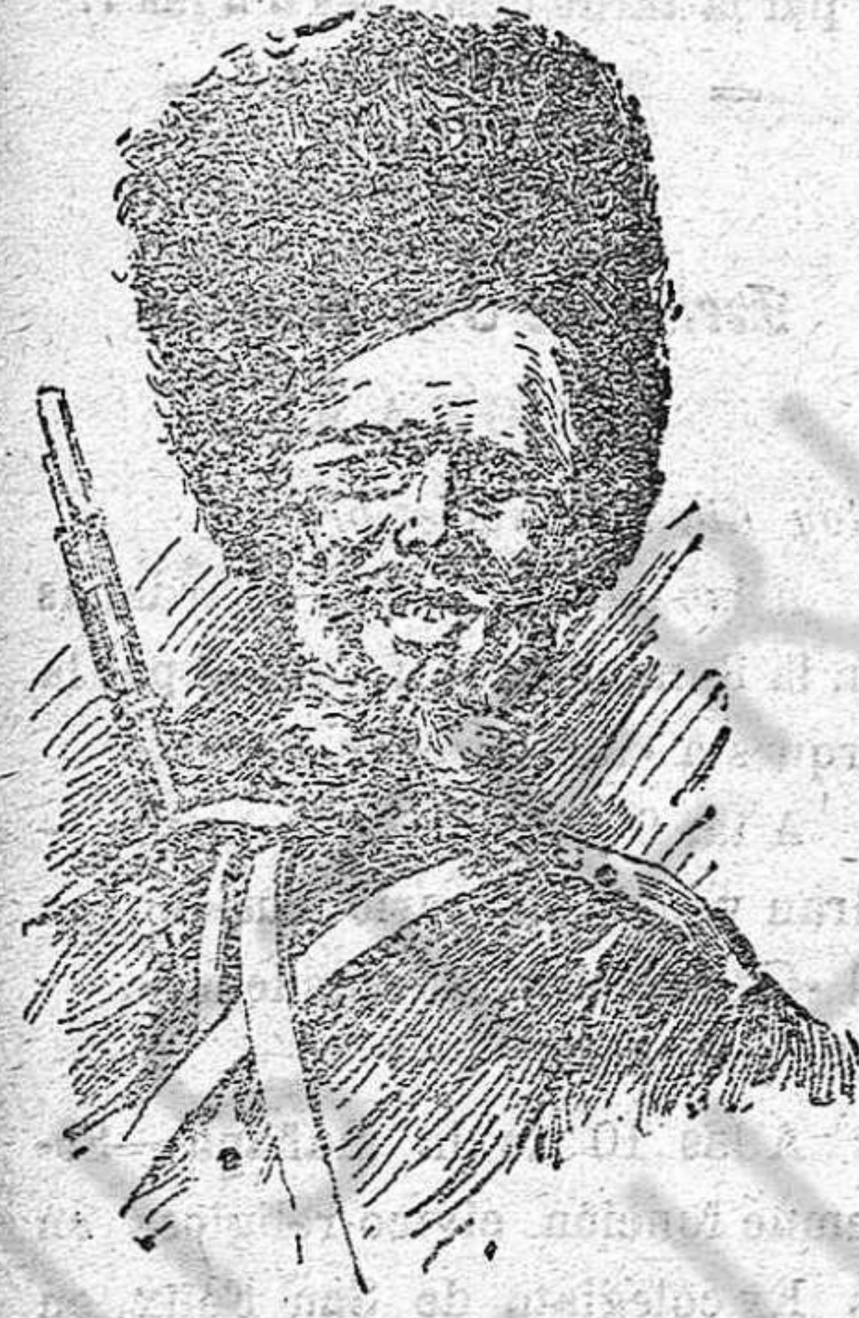
Tipo clásico del cosaco del Don