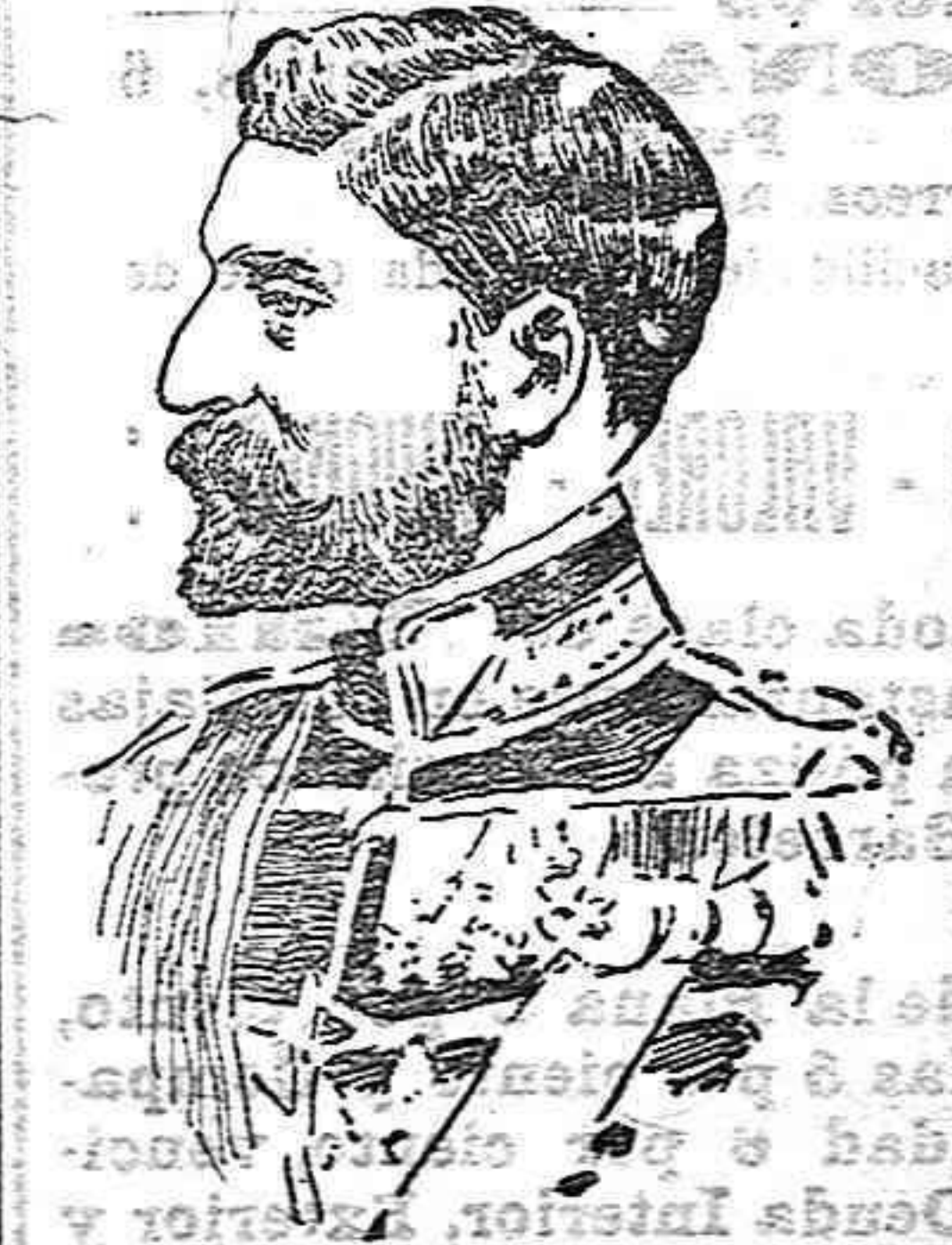
El rey Fernando de Runania

El Sindicalismo católico obrero tiene planteados muchos y graves problemas, cuya solución no depende de la facilidad de escribir de los escritores, ni de la vehemencia en el hablar de los propagandistas, ni de la intervención y manejos de los afluyentes, sino de la acción de los técnicos.