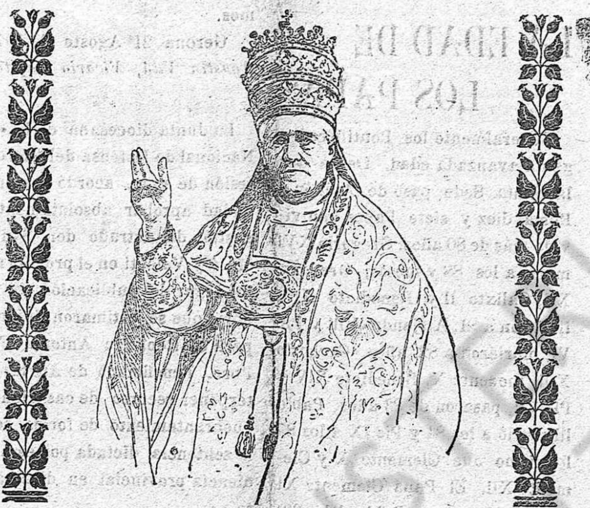
† Su Santidad el Papa Pío X

tudio fueron la característica del niño Sarto que lo mismo en la escuela primaria que en el Seminario descoló entre sus compañeros dándole notorio buen ejemplo.