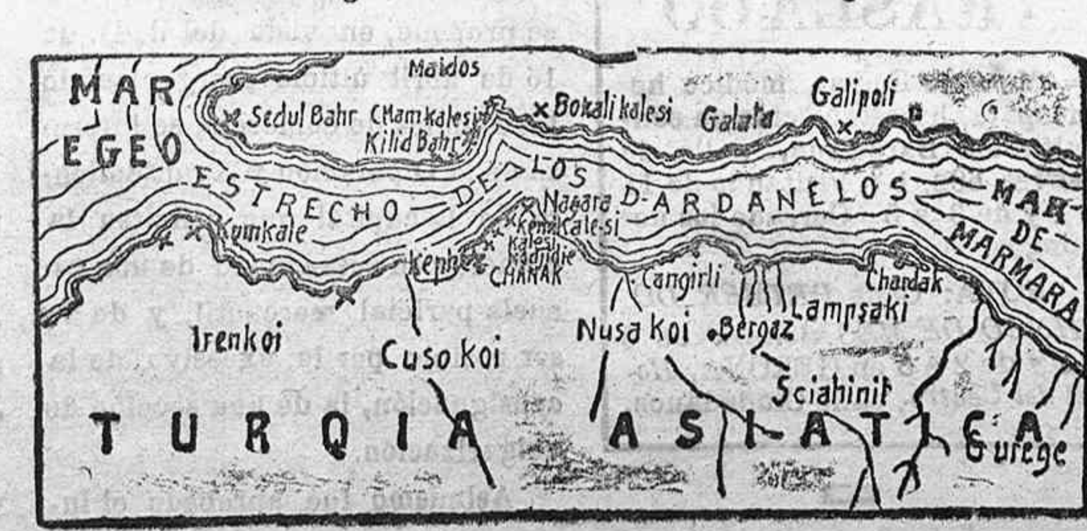
Gráfico de la defensa de los Dardanelos