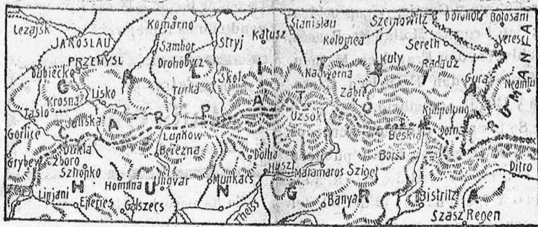
Gráfico de los Cárpatos

Aquestes obligacions seràn cotitzades oficialment en la Borsa de Barcelona.