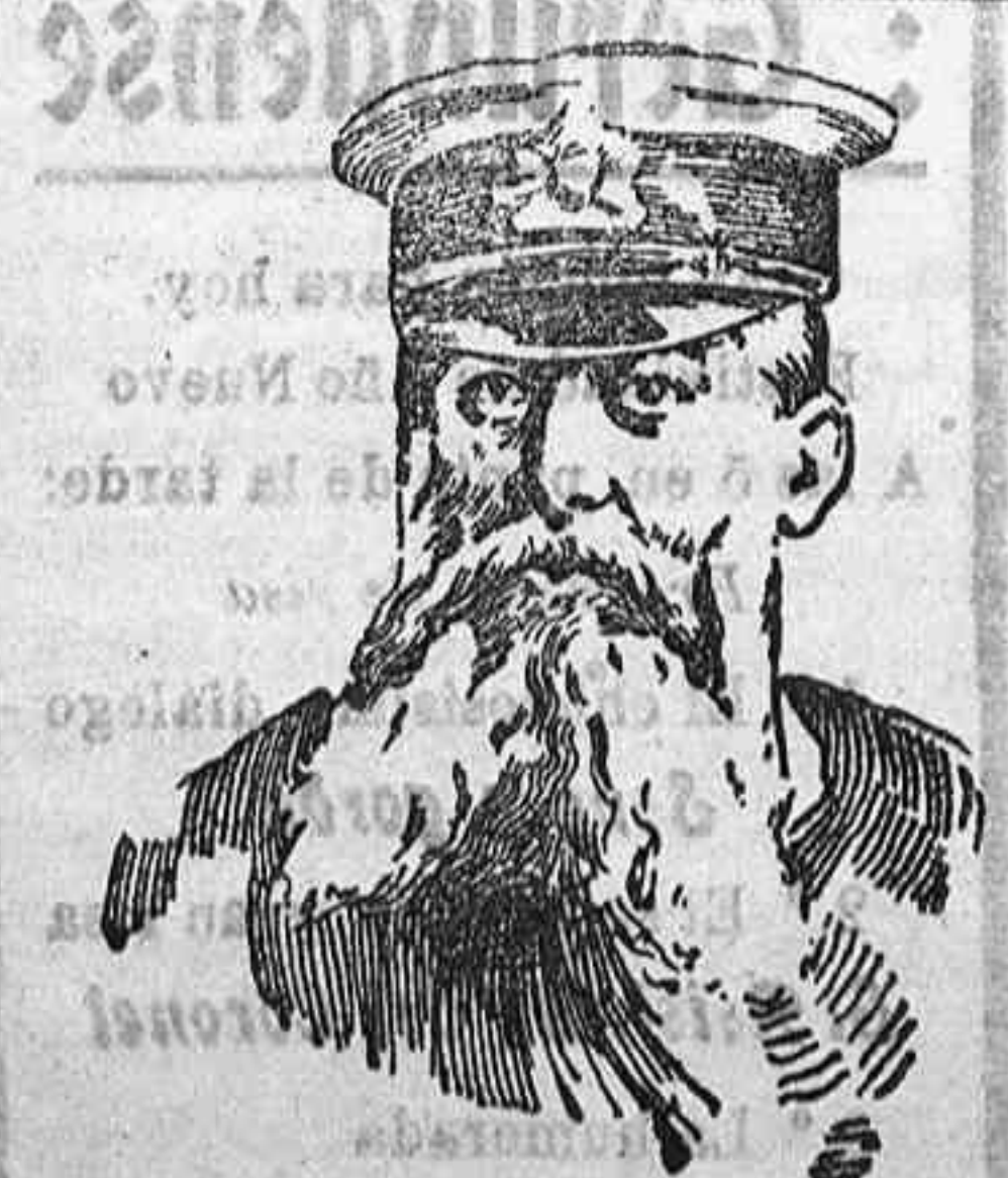
El almirante von Tirpitz Ministro de Marina de Alemania, que acaba de hacer importantes declaraciones sobre la futura acción de la flota alemana.