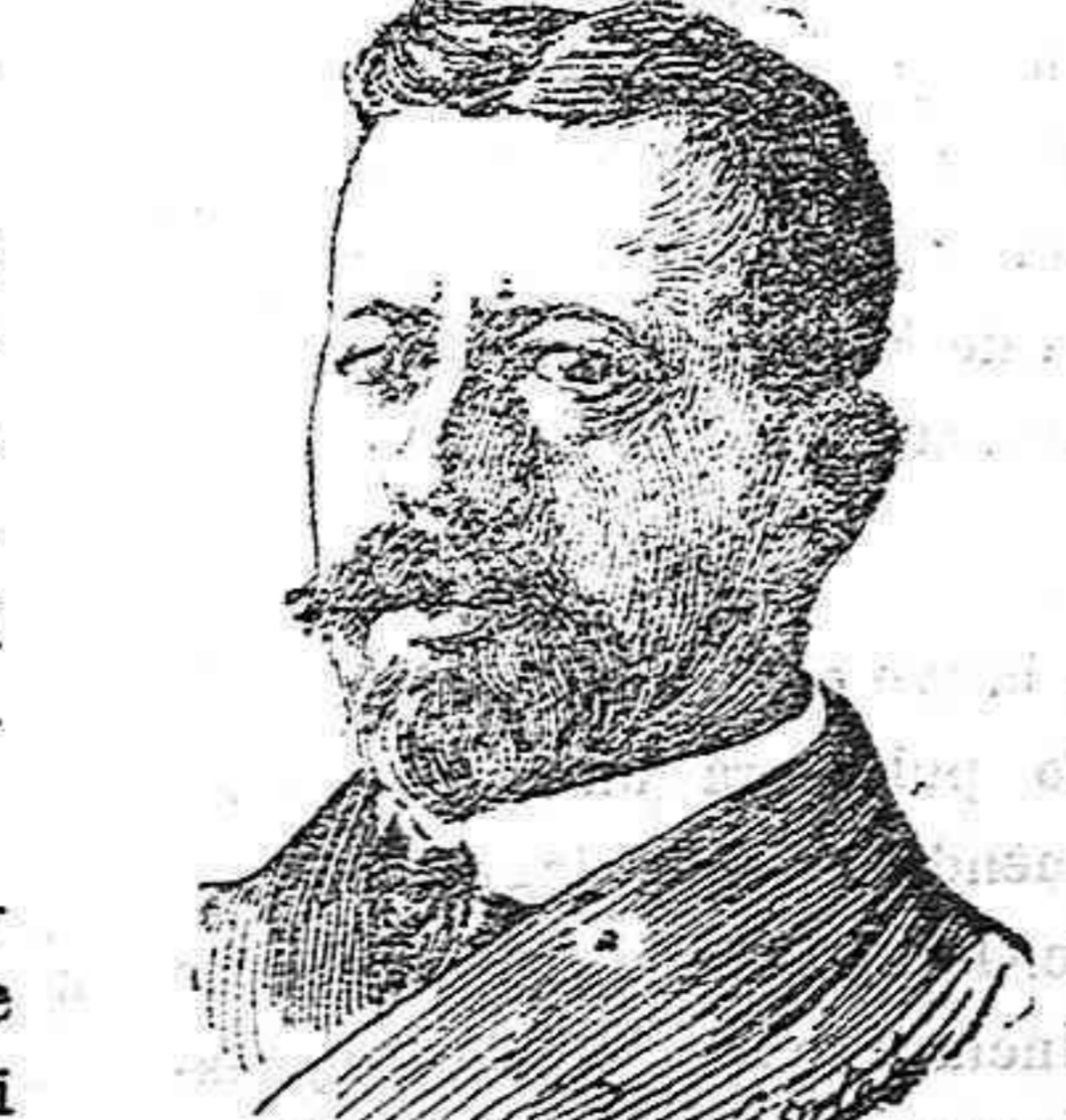
El Príncipe Enrique de Prusia el propio príncipe declaró que no llevaba ninguna misión política, pero que en sus entrevistas con las altas personalidades argentinas procuraría hacer más estrechas las relaciones que hoy existen entre los dos países, tanto en el terreno político como en el comercial, propósito que obedece a necesidades impuestas por lo que pudiéramos llamar plétora de vida. El pueblo alemán, por espíritu y

La gran prensa de Europa comenta en estos días, el viaje que a la República Argentina acaba de emprender el príncipe Enrique de Prusia, hermano del emperador Guillermo. El viaje no tiene carácter político, según las declaraciones oficiales y según reconocen todos los comentaristas; pero no por esto ha dejado de producir sensación y alarma en determinados países y en determinados centros. Oficialmente, el príncipe Enrique de Prusia va a la Argentina para incorporarse a la escuadra alemana que desde hace unos meses navega en aguas de América. Como inspector general que es de la Marina imperial, va a visitar dicha escuadra, y esto es todo... oficialmente. La causa de las inquietudes y comentarios producidos por este viaje, es la certidumbre de que el príncipe Enrique va a la Argentina para desempeñar una misión que de obtener el éxito que se pretende, ha de resultar muy provechosa para el comercio y la industria alemanes. Por si quedaba alguna duda respecto al objetivo del viaje, al embarcar en Hamburgo