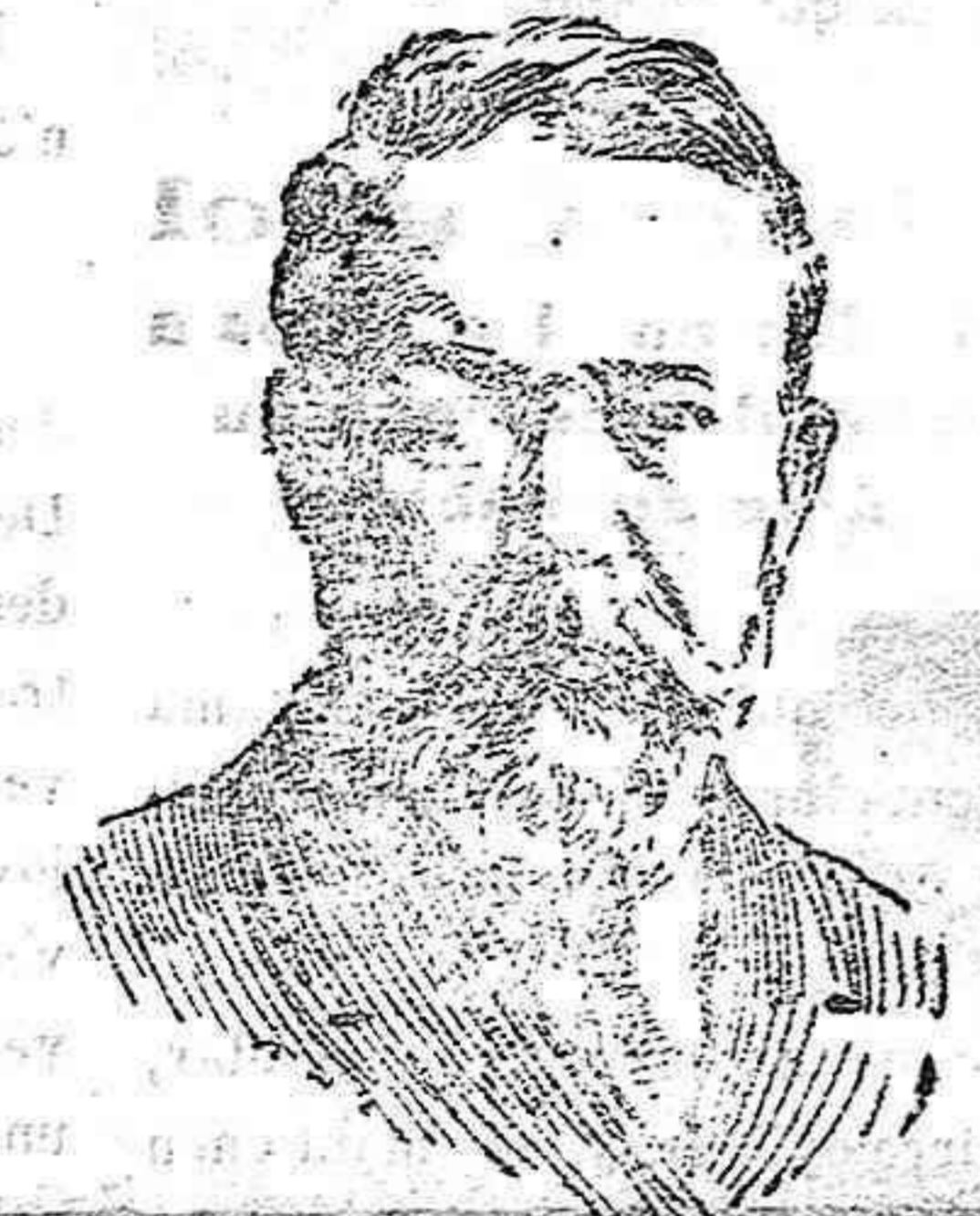
El ilustre pintor don Joaquín Sorolla elegido por la unanimidad académico de número de la Real Academia de San Fernando.