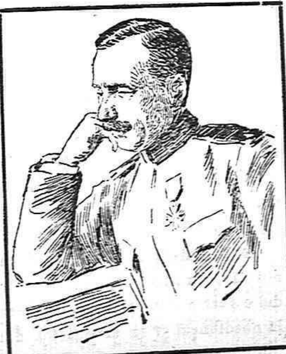
El general Iekow comandante en jefe del ejército búlgaro.