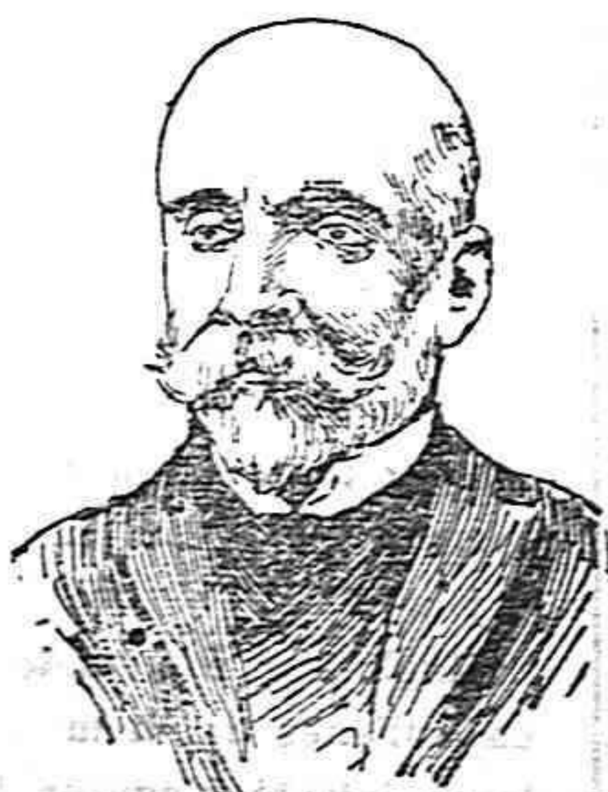
DON BERNARDINO MACHADO nuevo presidente de la República portuguesa.

Frente a estos hechos huelgan las palabras.