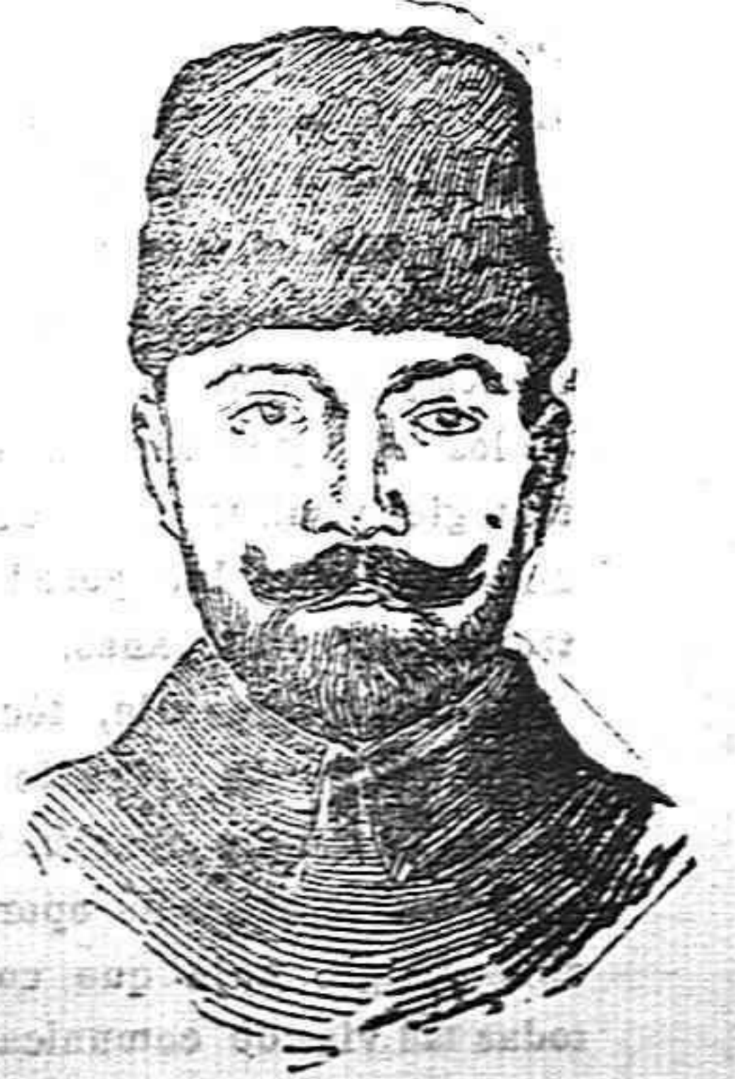
Djalmo pachá Comandante de uno de los ejércitos otomanos que pelean contra los rusos en el Cáucaso.