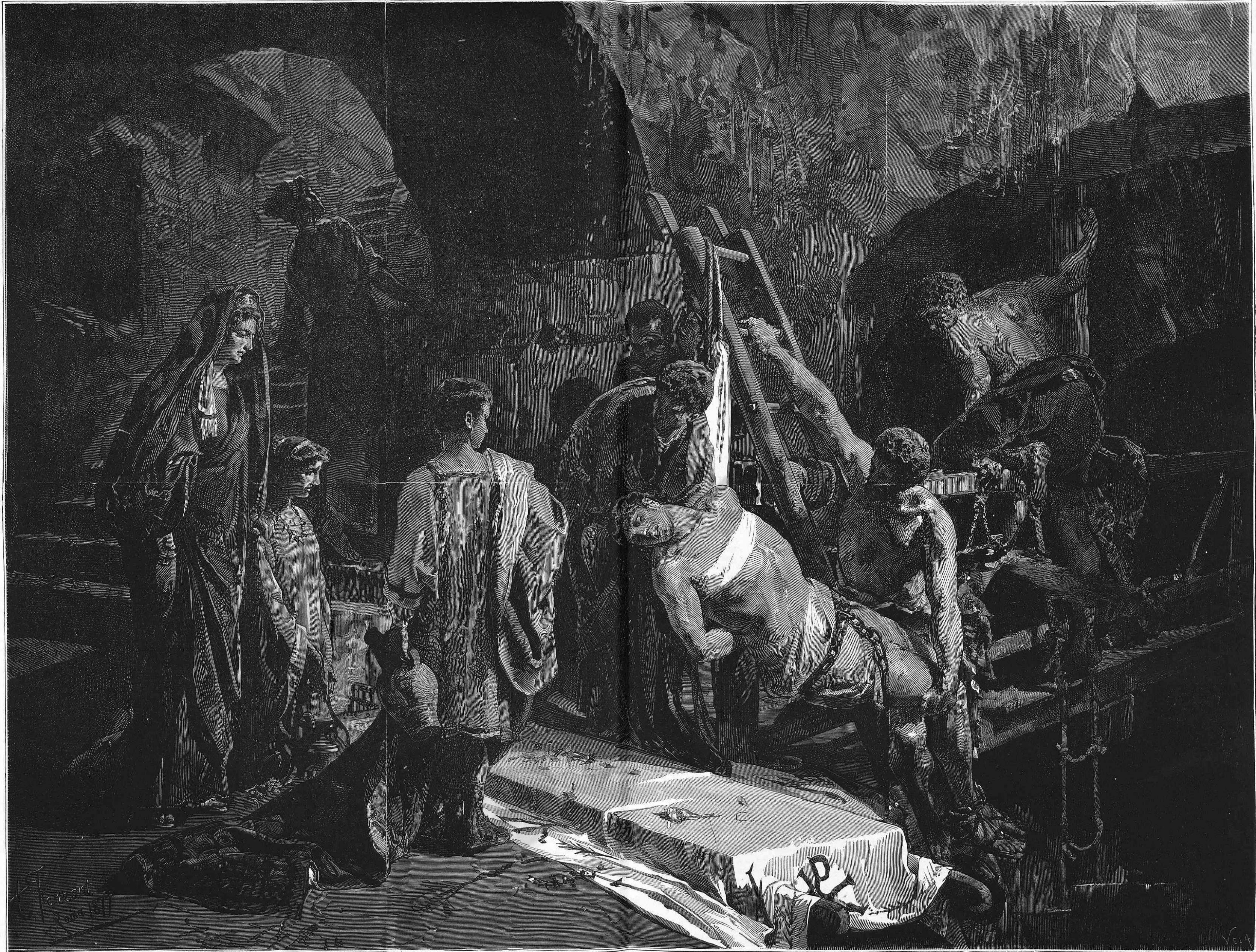
QUADRO DE FERRANT