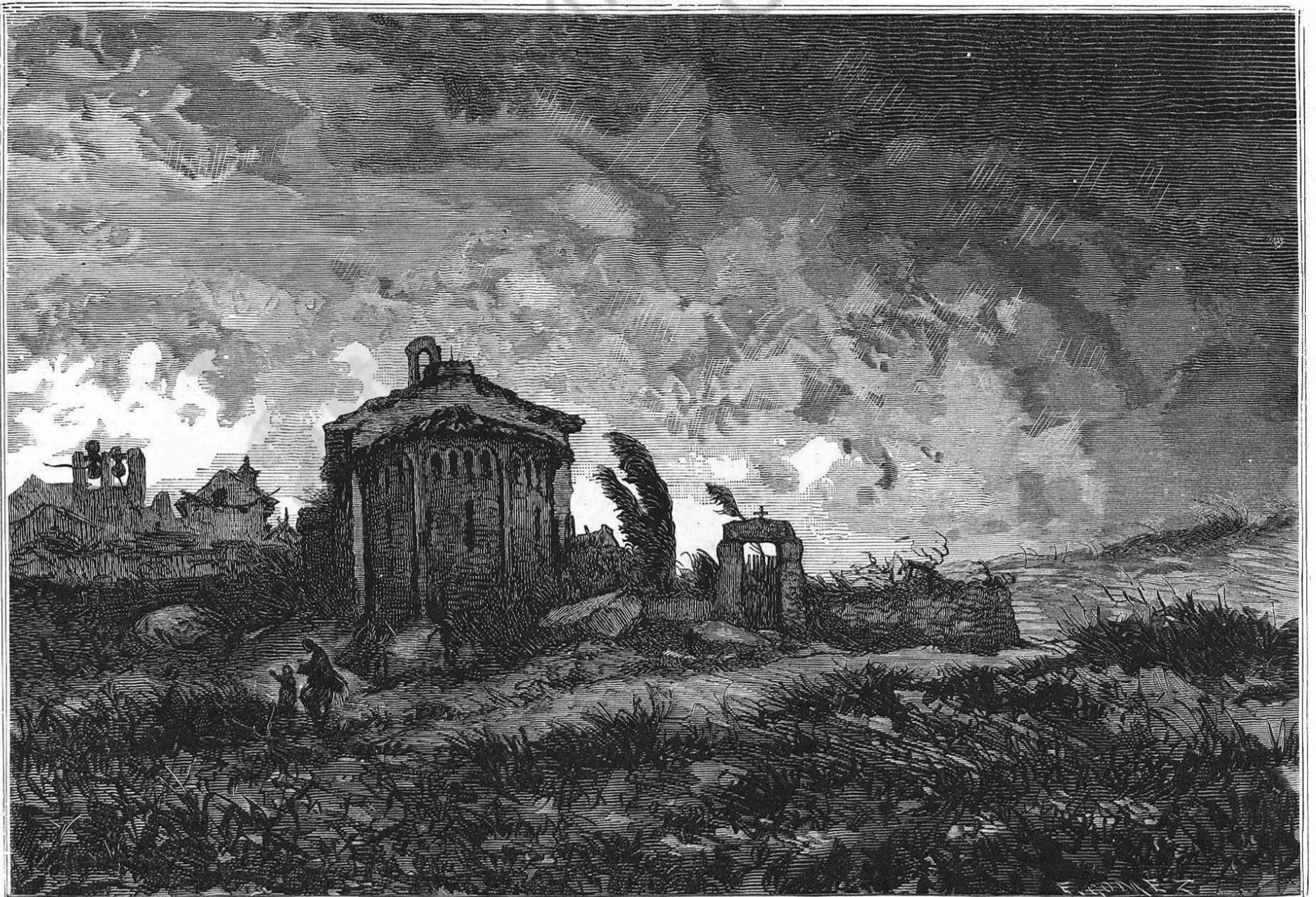
LO TOCH DEL MAL TEMPS

Los quadrets que ha fet á Venecia, tots de petites dimensions, demostren més clarament lo talent d' en Benlliure. La plassa de Sant March de aquella ciutat, ha donat bon motiu pera que hi lluhis sa fantasia. Un remolament de colors envolta per tots costats á una multitud de figuretas pintadas ab un gust exquisit. Eixa escena, que representa una de las antiguas tradicions venecianas, com es la de donar á mitj dia menjar á vols