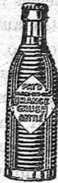
(Marca, botella y nombre registrados)

Exija siempre la botella original y rechace imitaciones.