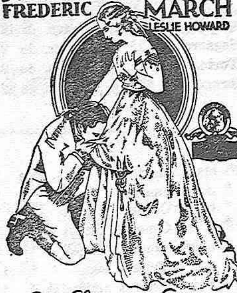
La Llama Eterna

NORMA SHEARER FREDERIC MARCH LESLIE HOWARD