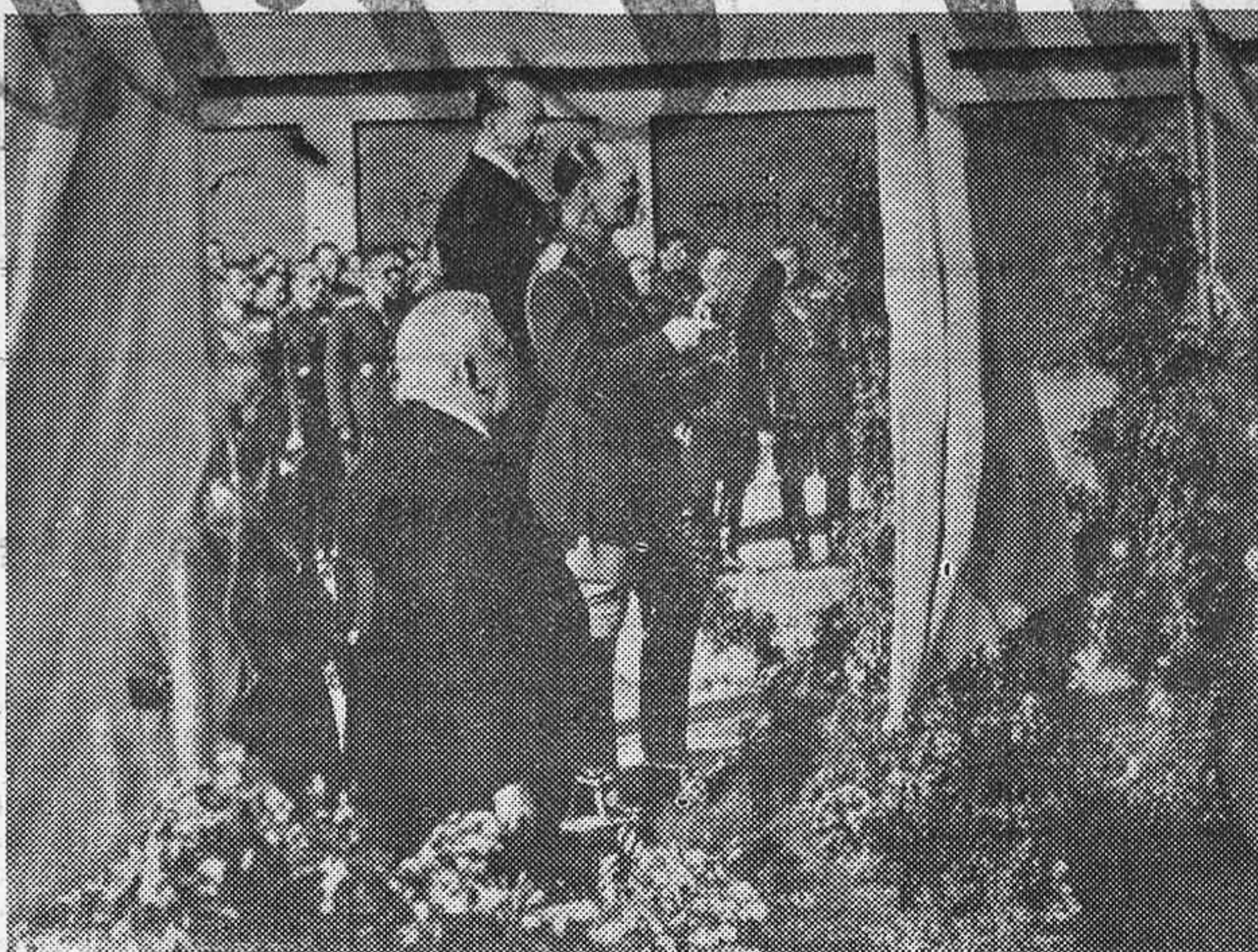
El Rey Jorge de Grecia asistió a la fiesta del primer regimiento de Artillería a Gondí, es la primera fiesta oficial a la cual asiste el Rey Jorge de Grecia desde su vuelta al Trono. El Rey Jorge teniendo a su izquierda el príncipe heredero y a su derecha el Presidente del Consejo, señor Domérmis, saludando la bandera del regimiento.