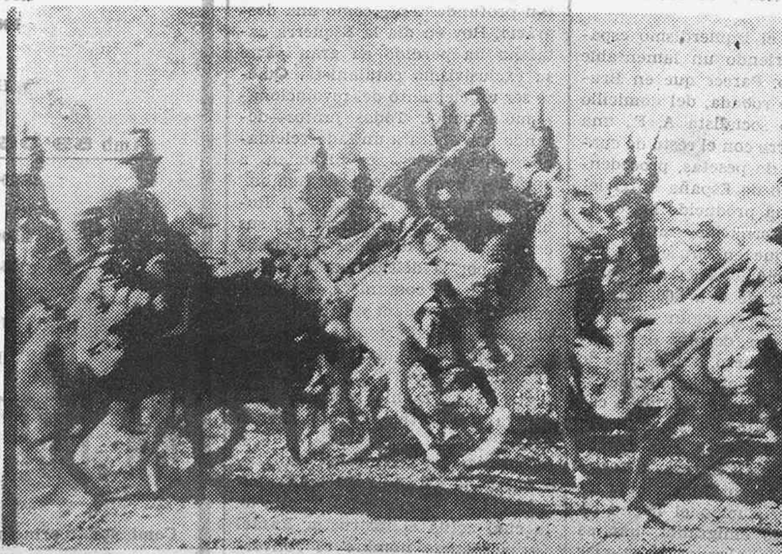
Askaris de la colonia italiana en Eritrea dirigiéndose a Adua, punto del éxito de sus operaciones. (Últimas fotografías de Abisinia).