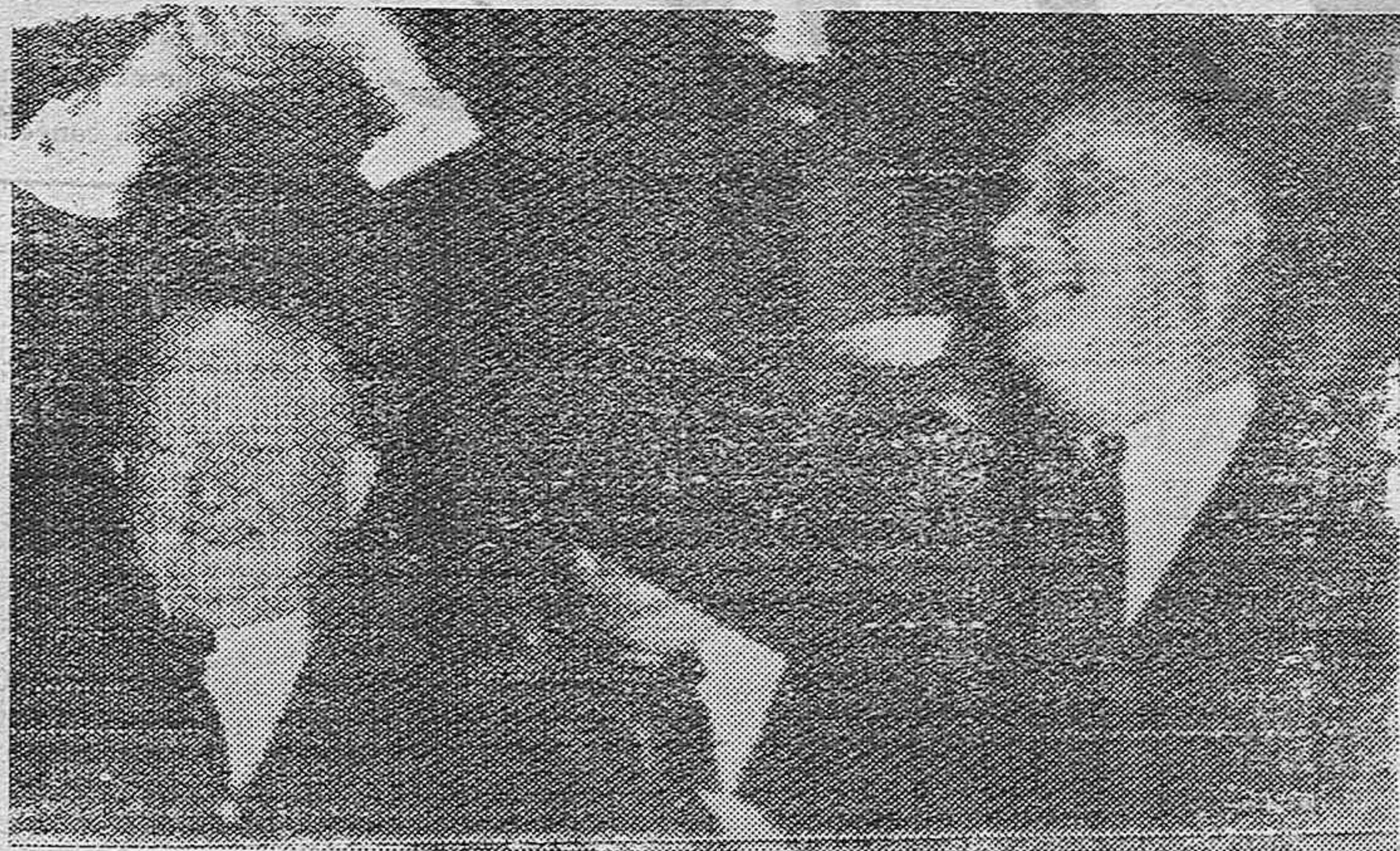
El presidente de los Estados Unidos, Franklin D. Roosevelt, dirigió la palabra a una enorme multitud durante el convenio de Filadelfia cuando aceptó la reelección como candidato democrático para la Presidencia de los Estados Unidos. John Garner, el candidato para vicepresidente estrechando calurosamente la mano de Roosevelt al aceptar esta reelección a la candidatura.