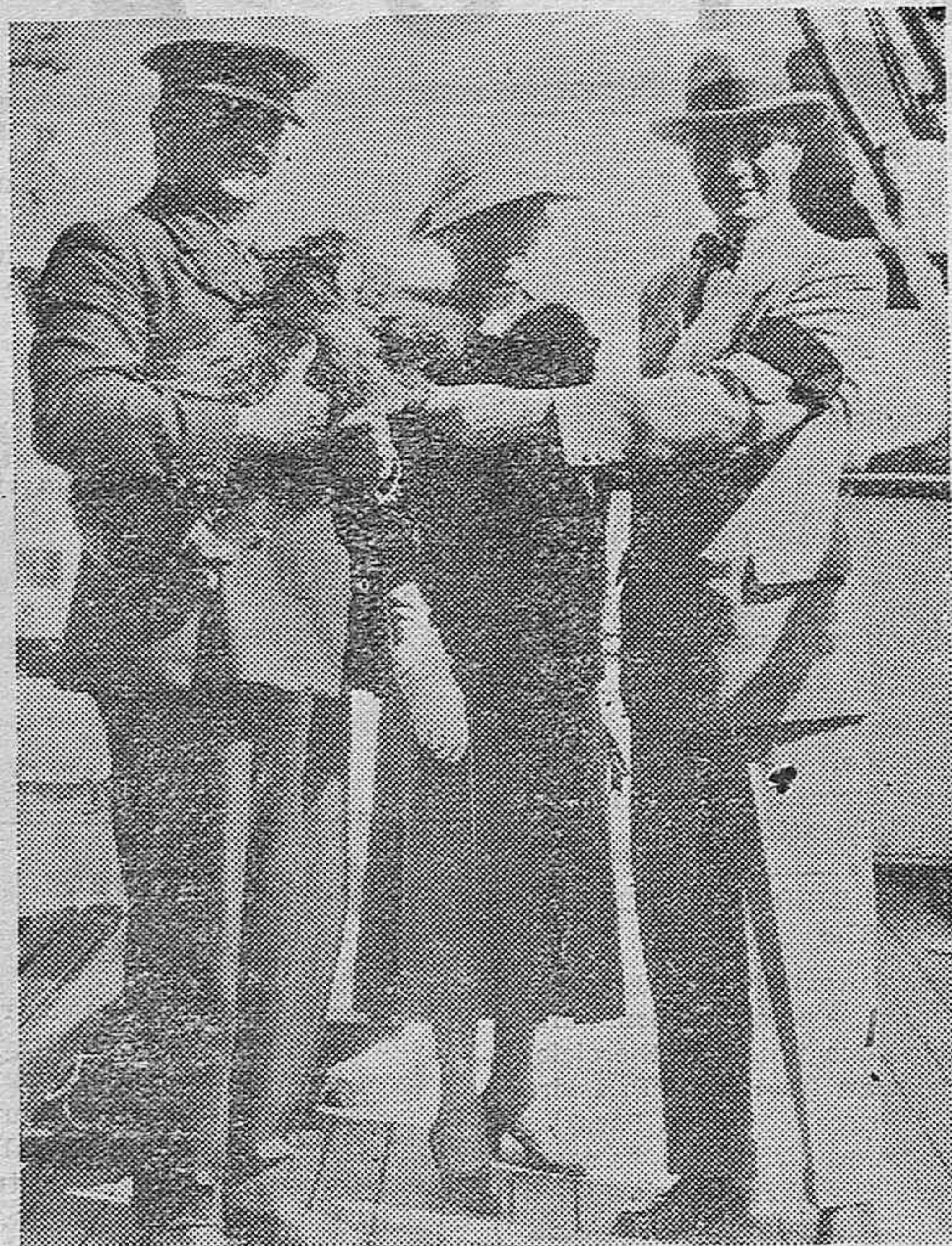
Sir Sidney Barton, ministro británico en Addis Abeba, represa a Inglaterra después de una temporada de violencia en Abisinia.

Per a aconseguir-ho organitzats els seus associats un concurs a base de cinc proves socials, la primera de les quals ja fou correguda diumenge darrer i tingué gran alicient.