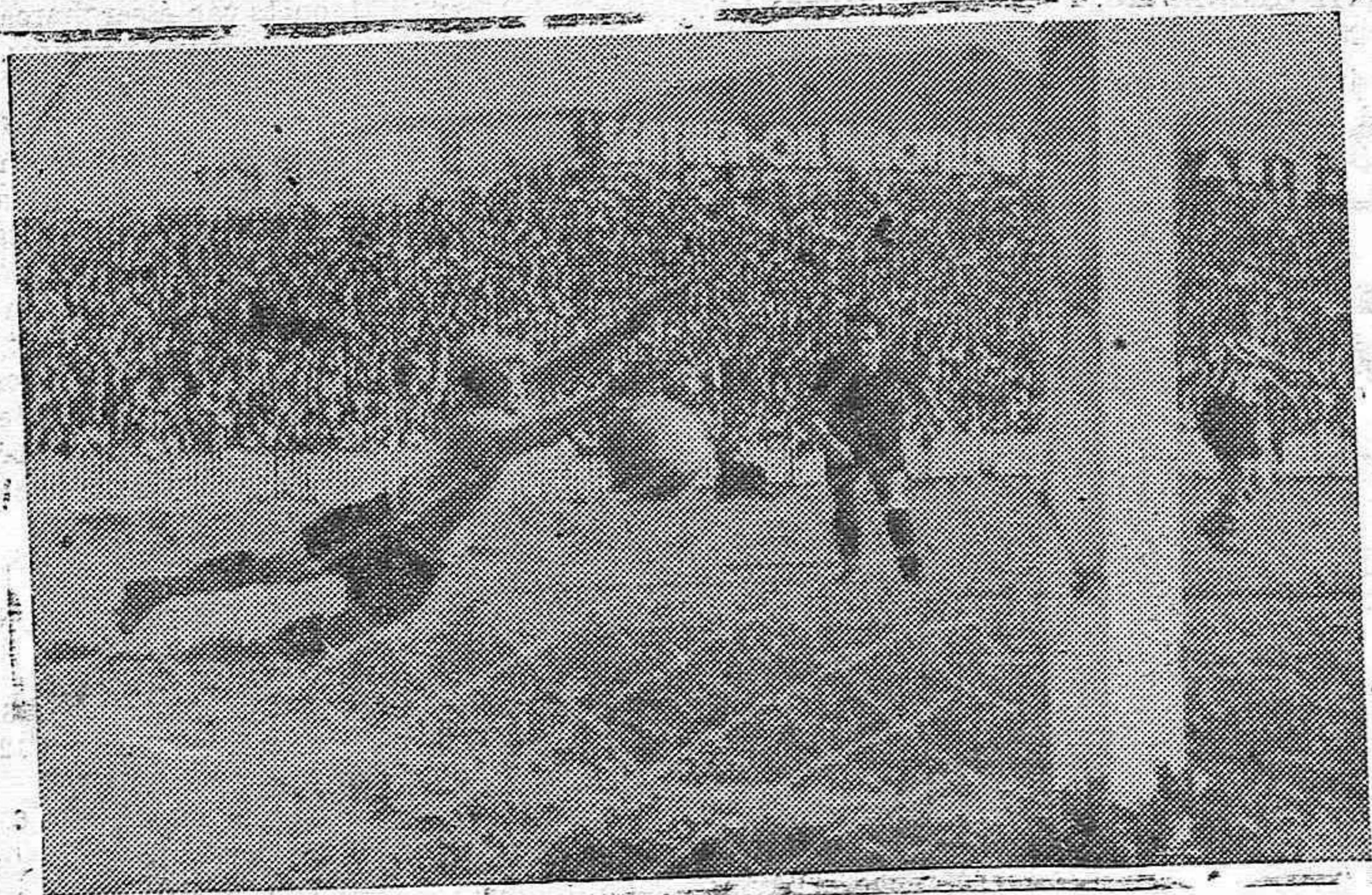
Ventolrà ha passat a Escolà, rema tant aquest i conseguint l'únic gol de la tarda, pel "Barcelona".