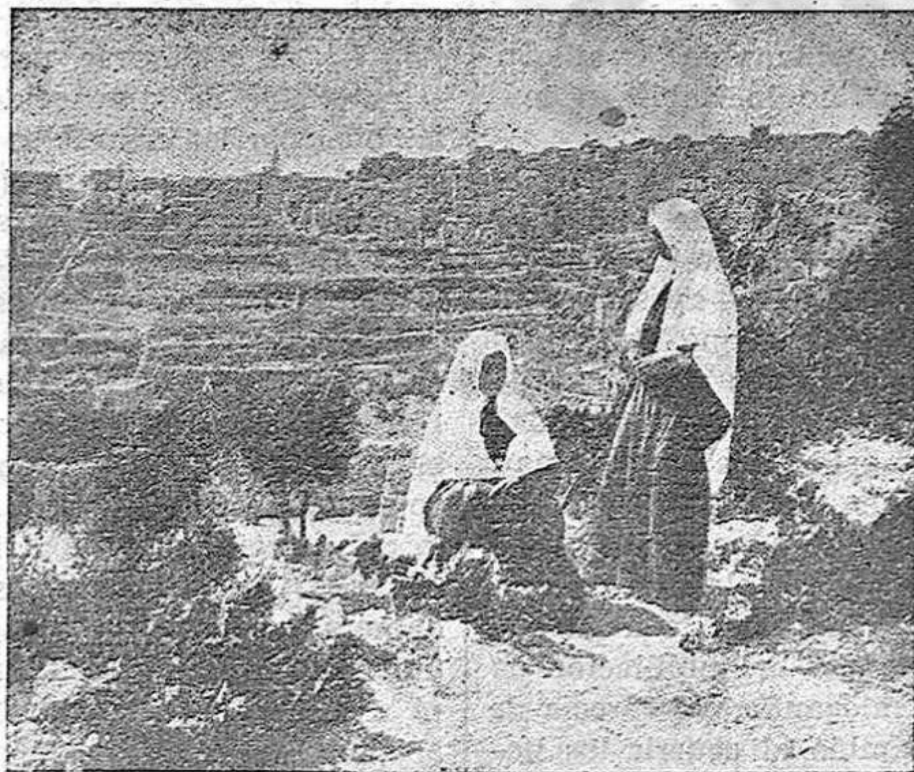
Vista general de Nazaret