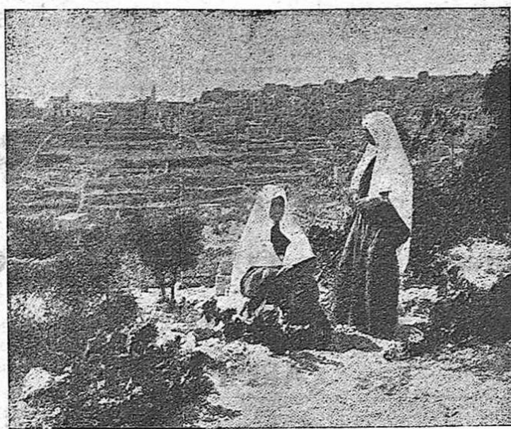
Vista general de Nazaret