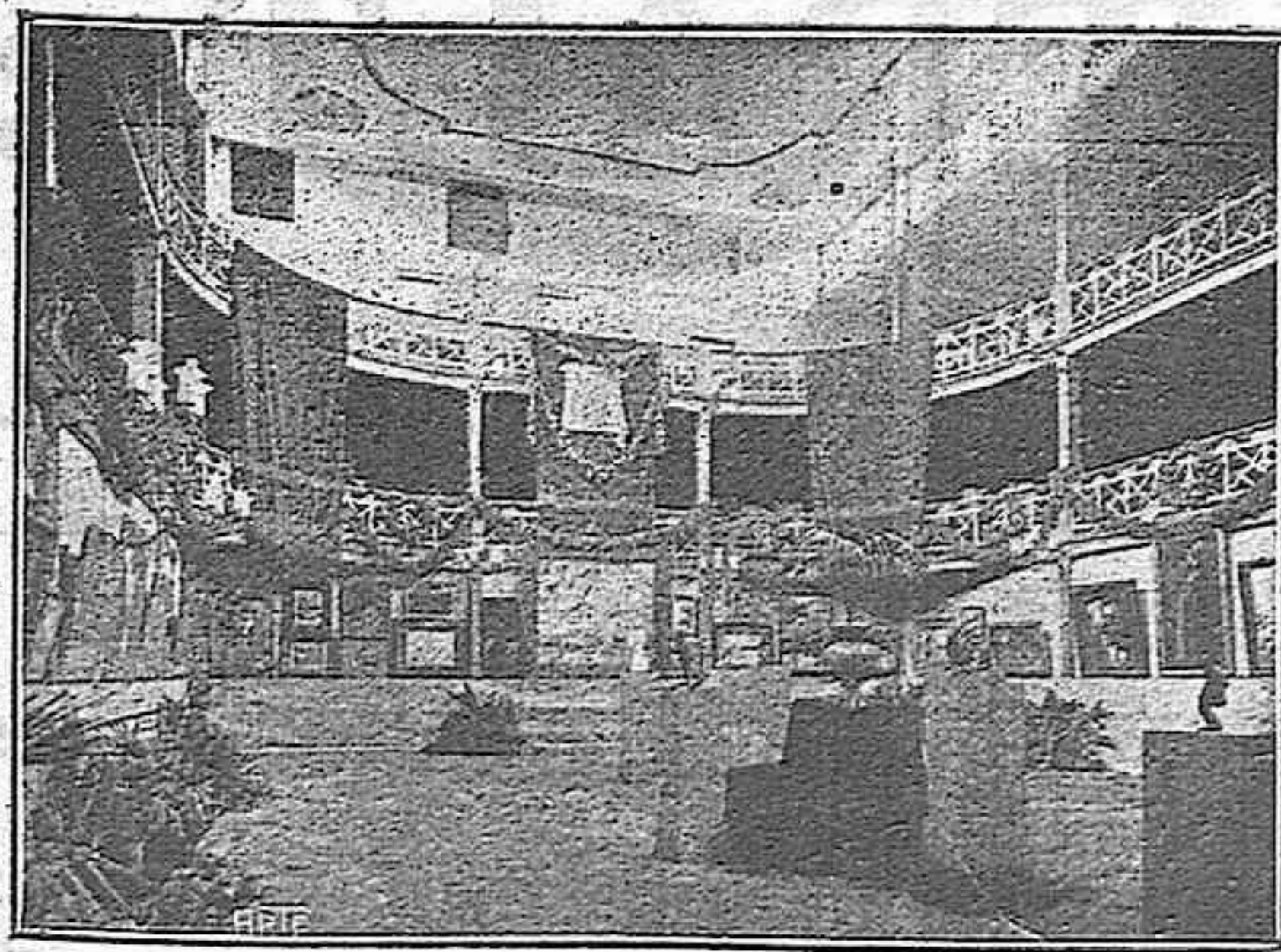
UNA VISTA DEL TEATRE DURANT UNA EXPOSICIÓ

Grans sessions de cine per a avui. Esplèndid programa. Sessions tarda i nit.