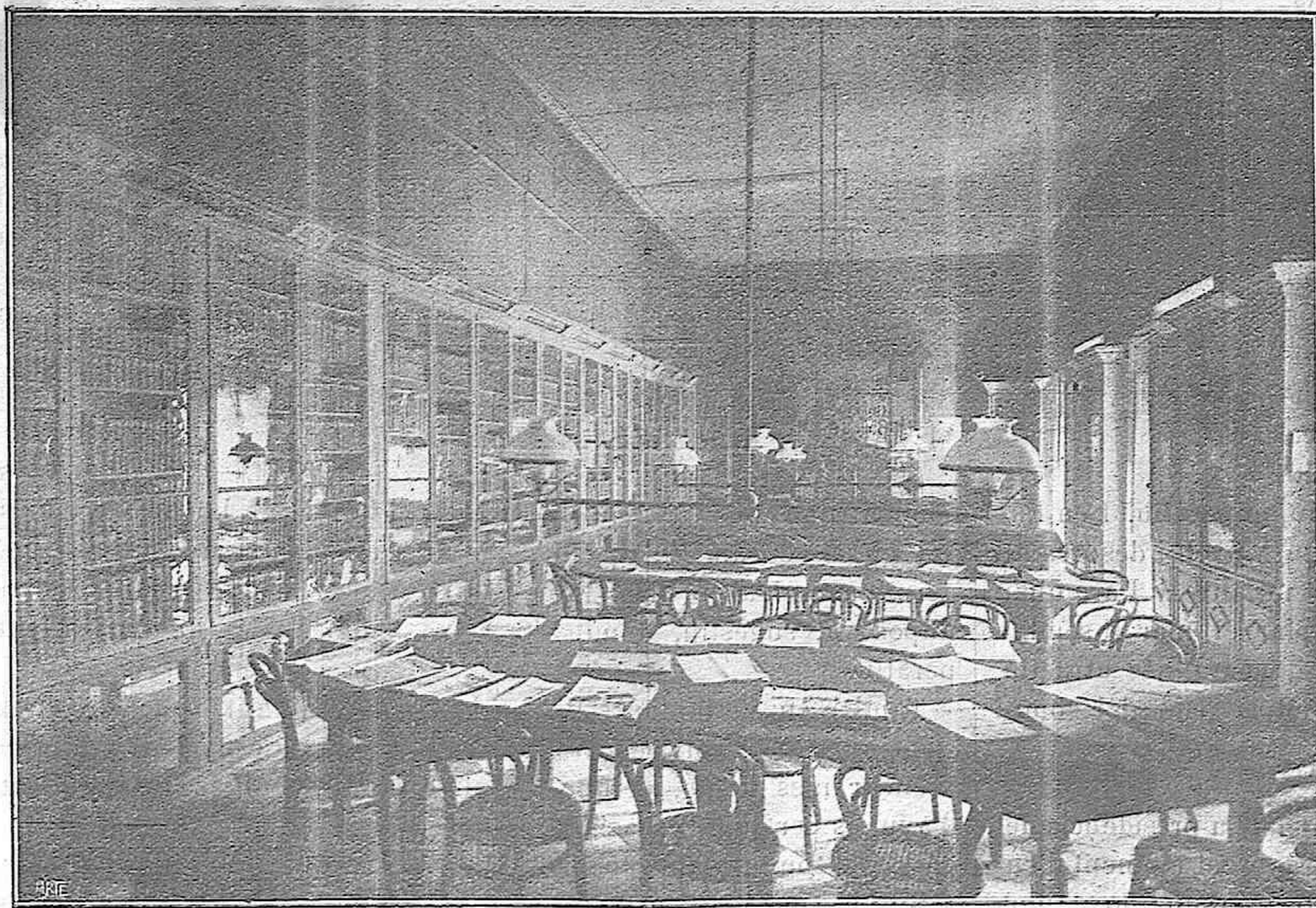
CENTRE DE LECTURA