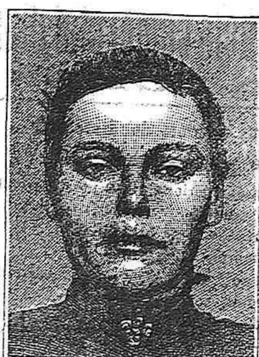
Después de 15 días del tratamiento