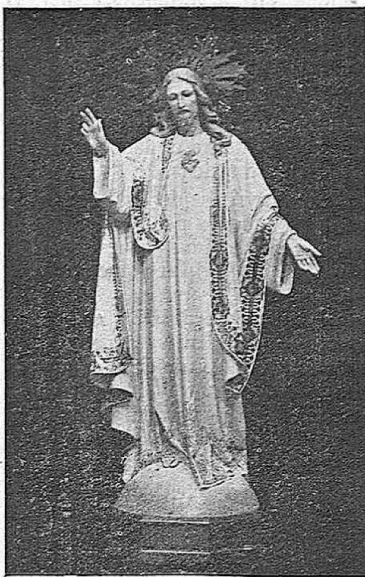
Imatge del Sagrat Cor de Jesús, ofrena d'una família devota a la parròquia de la Santíssima Trinitat que ahir fou beneïda i serà instal·lada en el seu altar bellament restaurat.