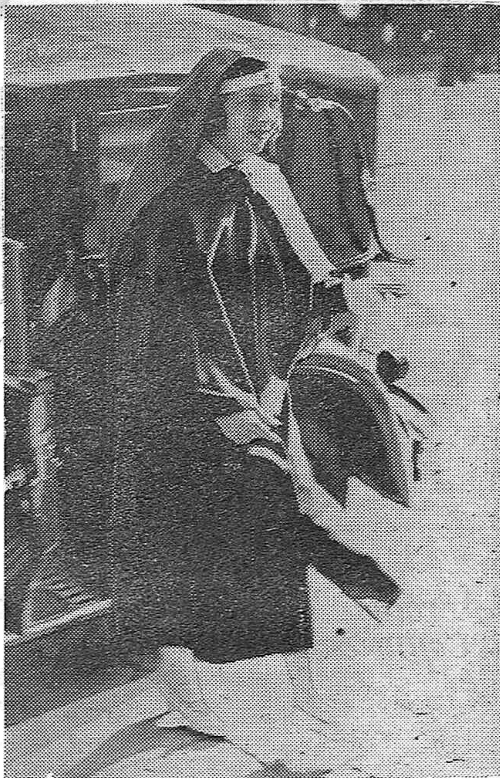
La princesa María José de Piemonte, que últimamente dió a luz una niña, está actualmente en Nápoles. Aquí la vemos vestida de enfermera de la Cruz Roja, dirigiéndose a eir una misa celebrada en memoria de las enfermeras de la Cruz Roja muertas durante la guerra. Es la primera salida de la princesa María después del nacimiento de su hija.