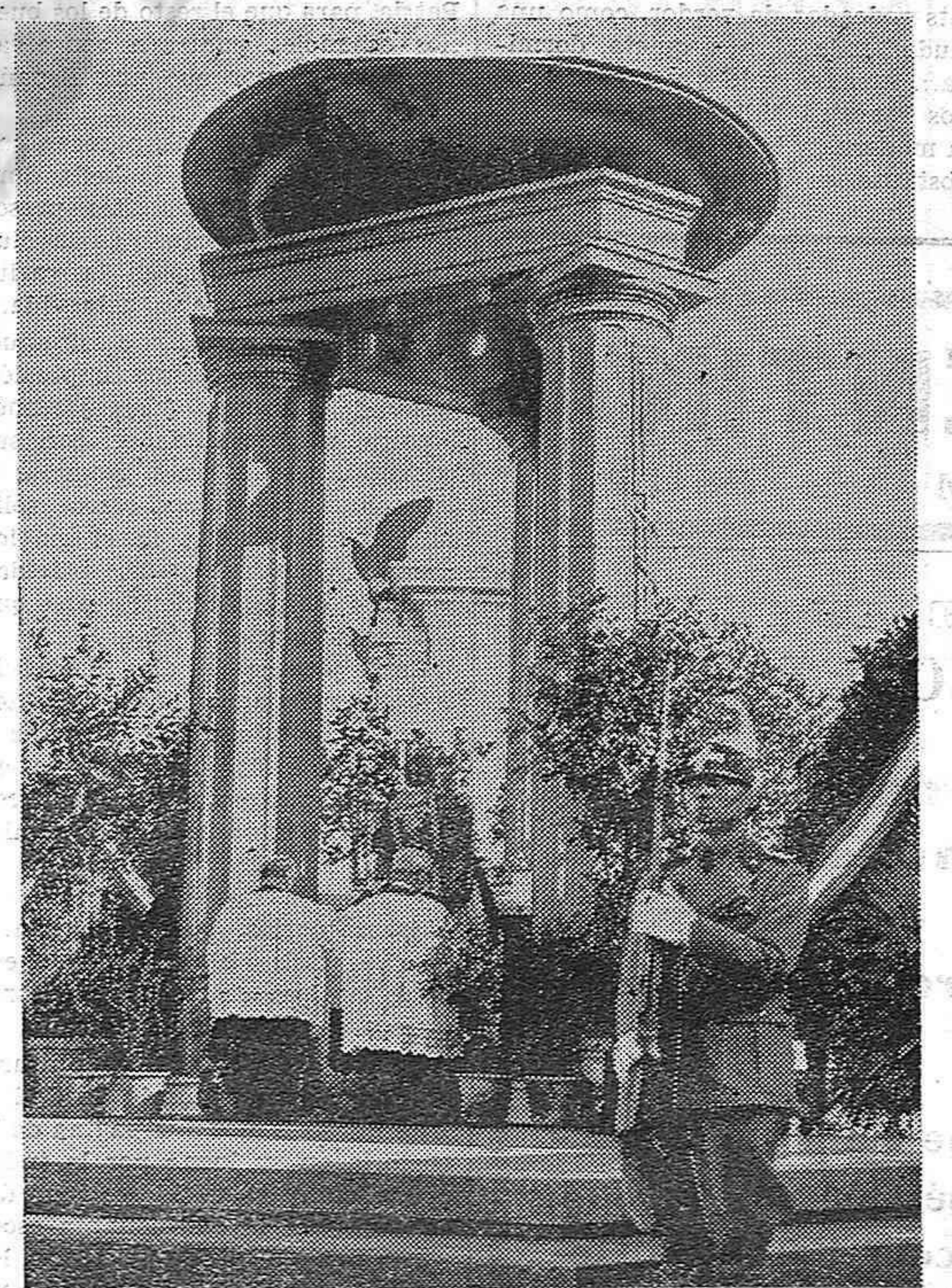
Express Foto En Verano (Italia) se ha celebrado una solemne ceremonia religiosa en memoria de los soldados italianos y franceses muertos en la guerra. Un aspecto del altar durante la misa.

Tenim notícies que per assistir als actes de cada dia es contractaran autobusos des de Reus, Valls i altres poblacions. I les Comissions designades per a atendre els setmanistes durant llur sojorn a la nostra ciutat curen d'assolir condicions excepcionals dels hotels i han preparat visites collectives als monuments de Tarragona, acompanyats d'arqueòlegs eminents que els faran de guia. Catòlics de Catalunya! Encoratgeu-vos! Ara més que mai a estudiar i a practicar l'Acció Catòlica. De les quatre branques de què es compona—homes, dones, joventut masculina i joventut femenina—inscriviu-vos i actueu en la que us correspongui, i aporteu-hi el màxim de les vostres prestacions. Per un voler de Déu, la Pàtria acaba de sortejar un perill de mort! Quietes ja les armes ofensives, acabin de consolidar la victòria les armes pacífiques de l'amor que va predicar Nostre Senyor. Tots a Tarragona del 25 de Novembre al 2 de Desembre d'enguany.