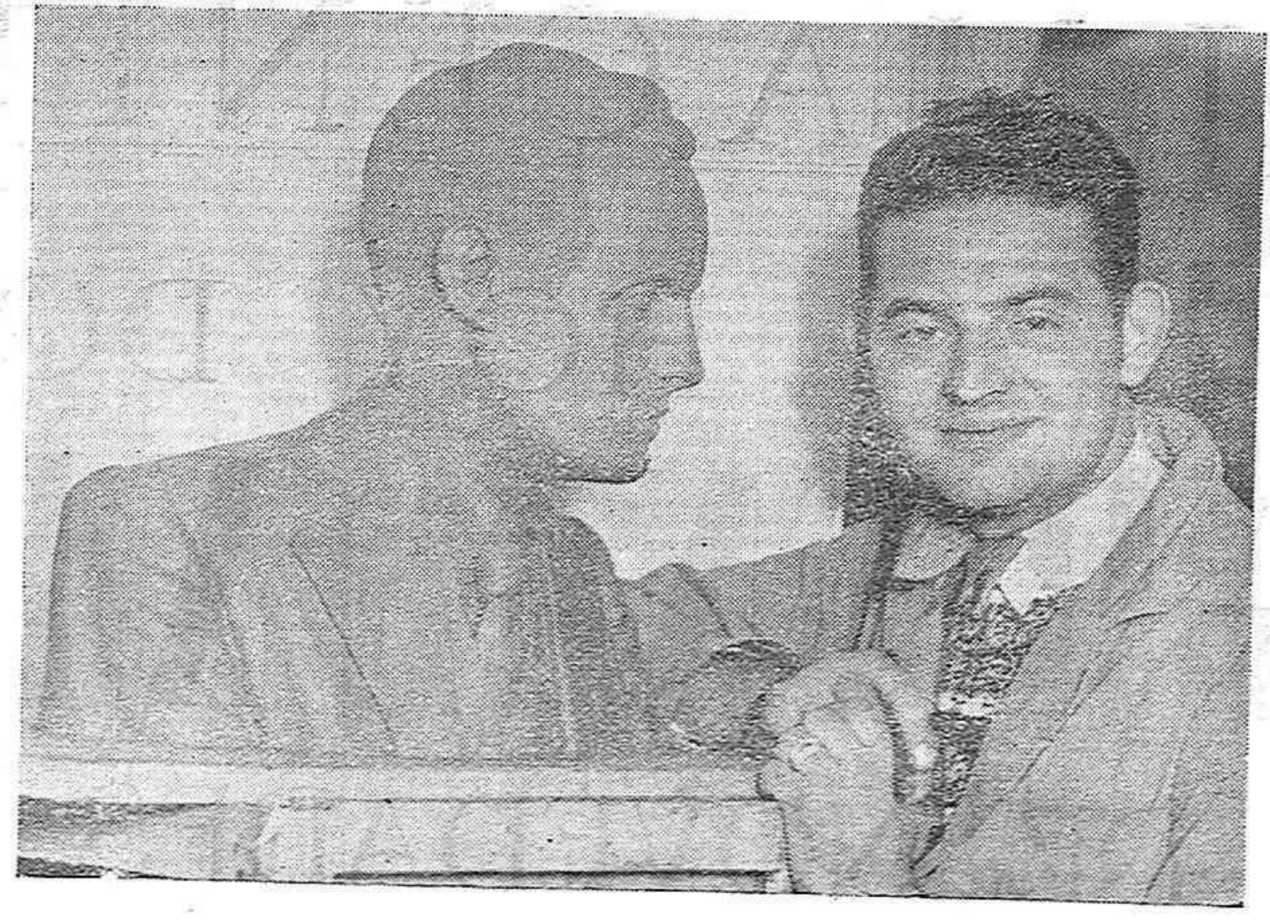
L'artista Rafel Cases i Solé, i el bust d'En Josep M. a Tarrasa, la seva darrera obra

HOY Colecta Pro Culto y Clero en todas las iglesias de esta capital