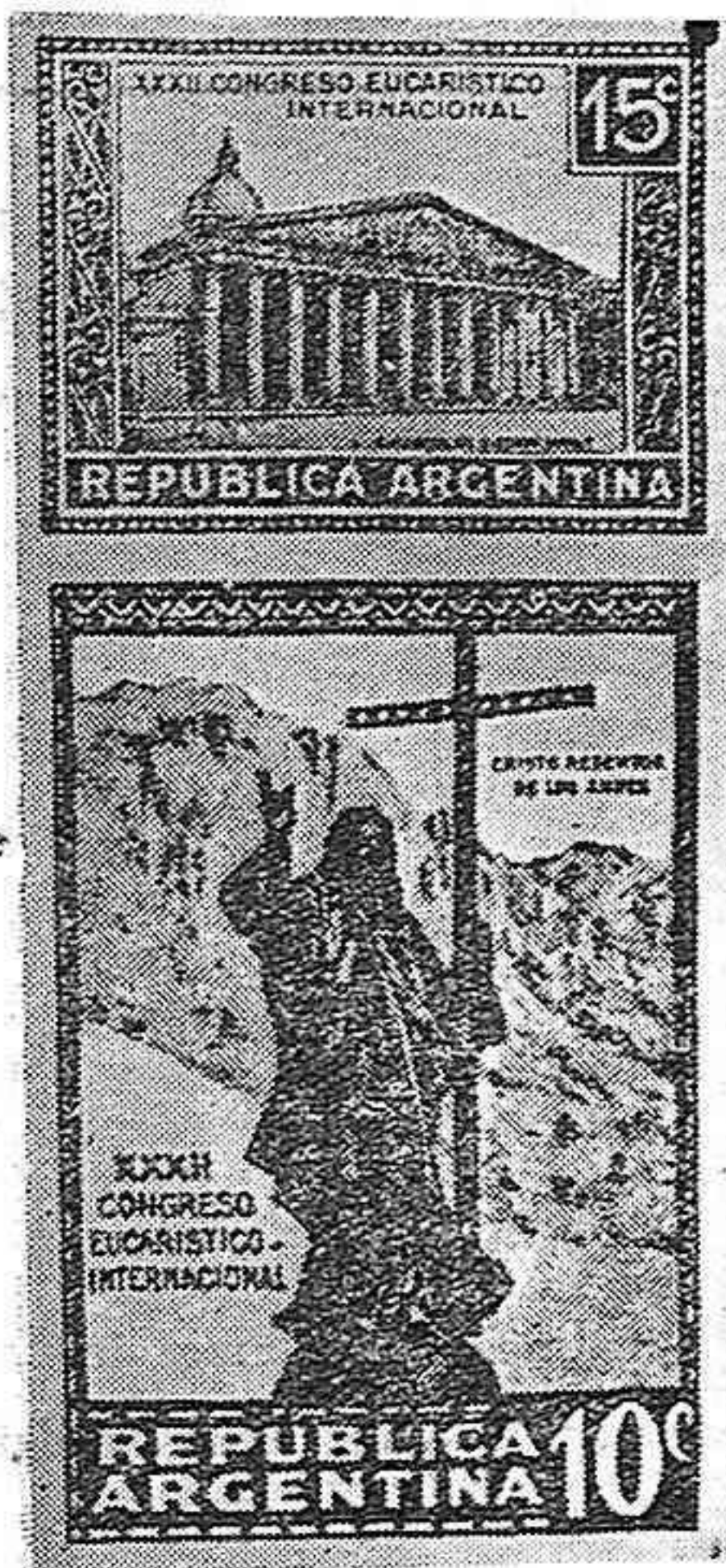
Nuestra fotografía reproduce los sellos emitidos en ocasión de este Congreso. El de arriba reproduce la Catedral de Buenos Aires y el de abajo, una estatua gigantesca construida en la frontera de Chile-Argentina.