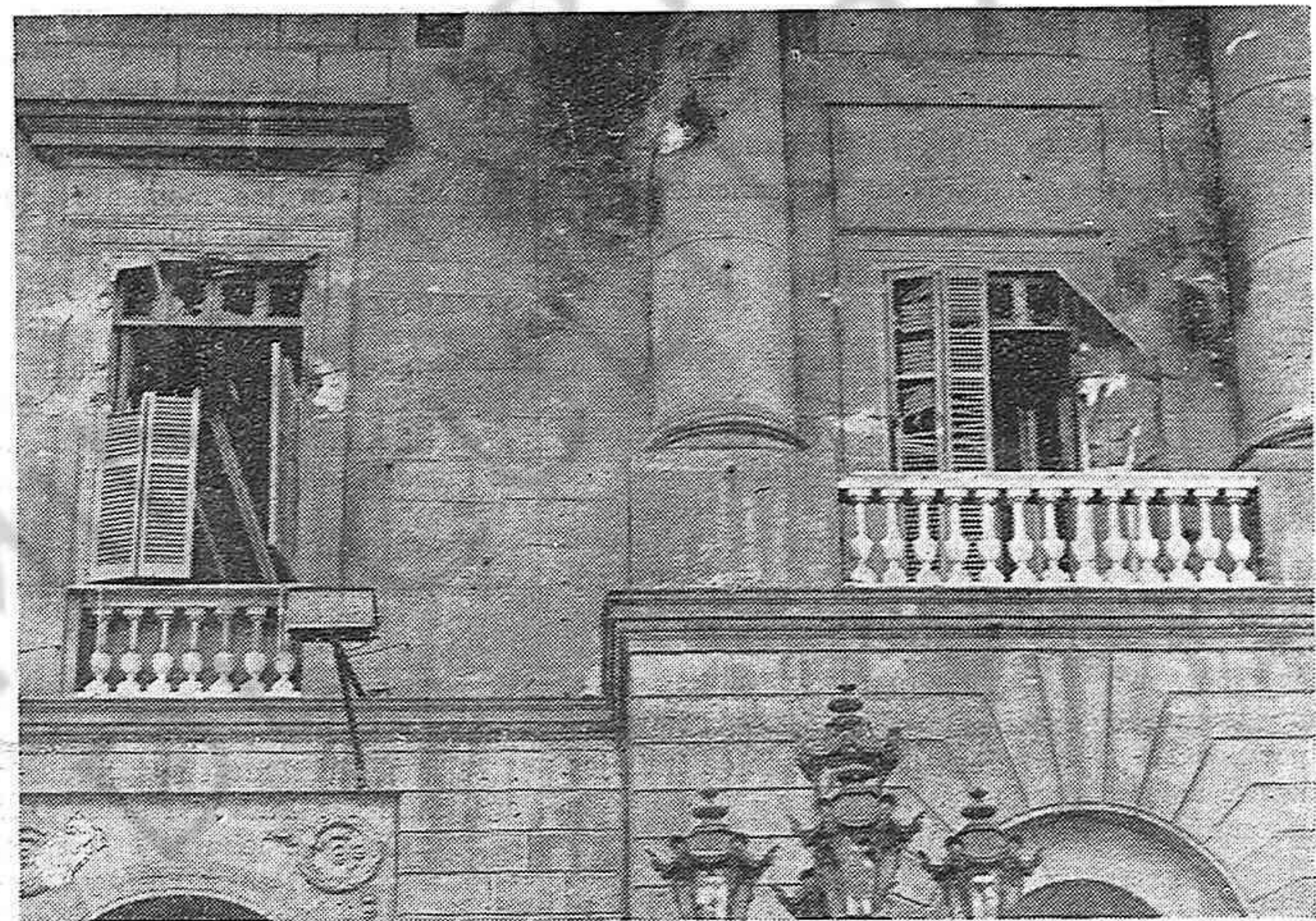
Balcones del Ayuntamiento de Barcelona, destrozados a cañonazos en la noche del 6 de octubre