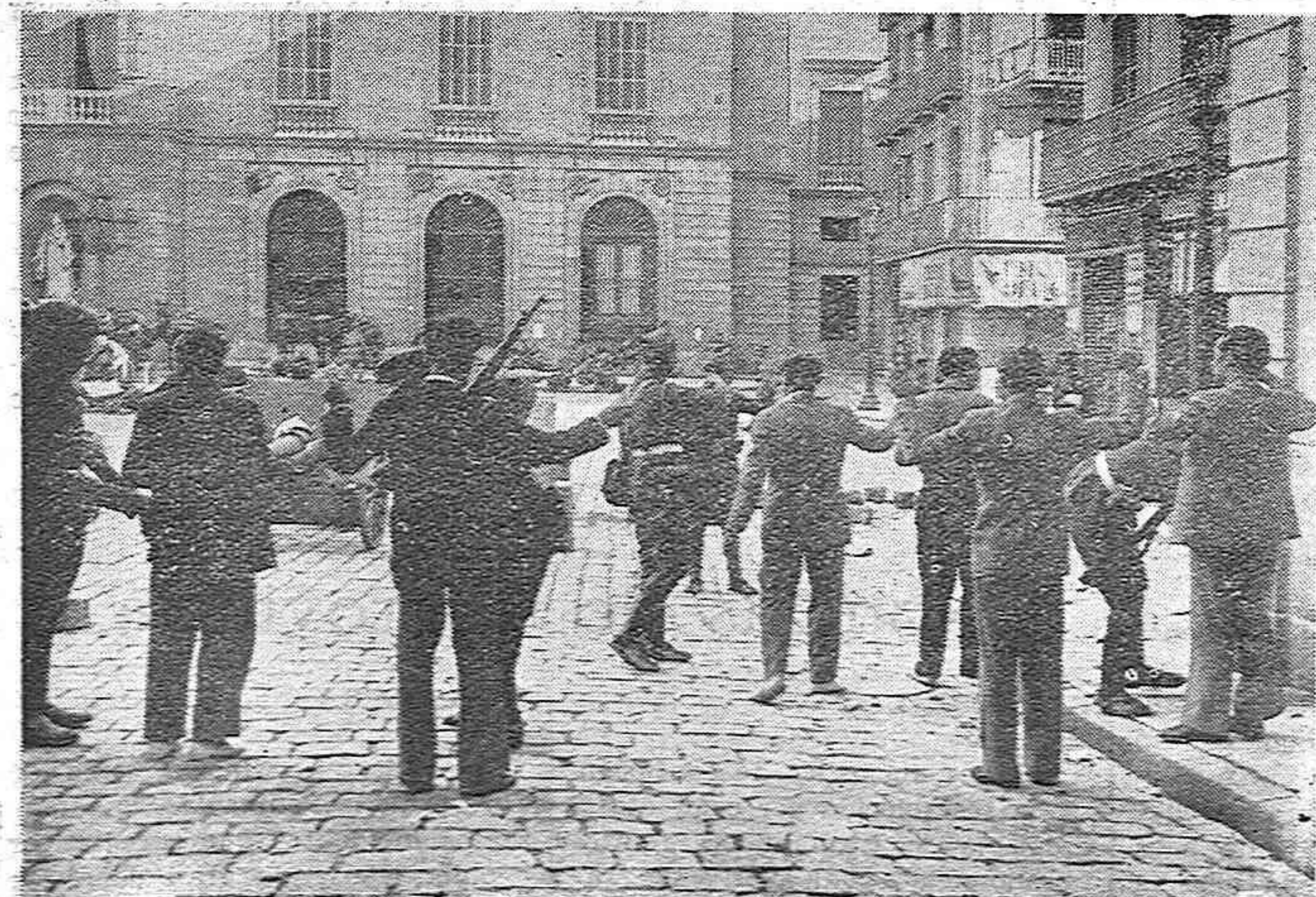
Cacheo en la plaza de la República, después de la misma por las fuerzas del ejército

ESTE NUMERO SE PUBLICA CON CENSURA DE LA AUTORIDAD MILITAR