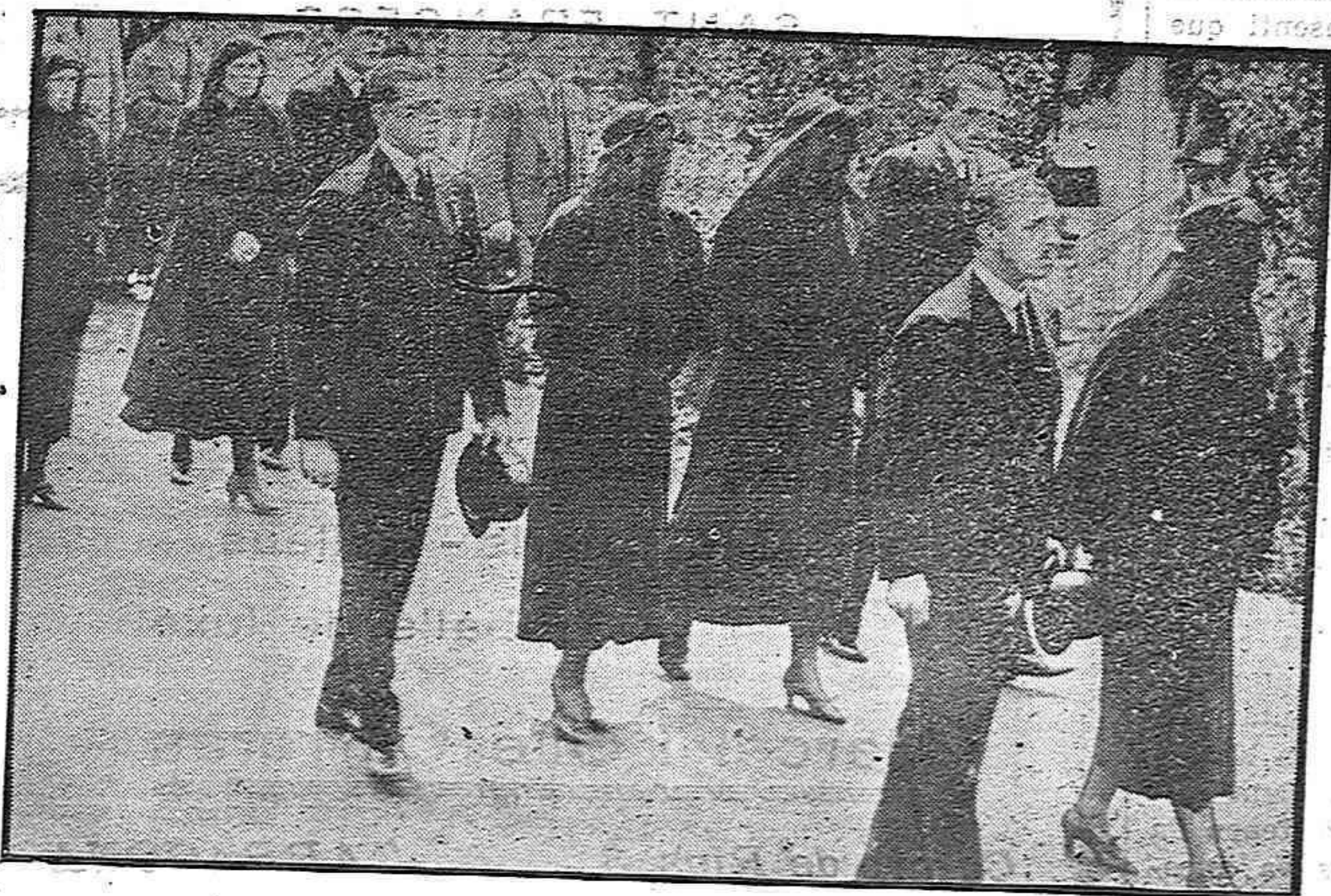
La ex-familia real presidiendo el duelo del entierro del infante D. Gonzalo