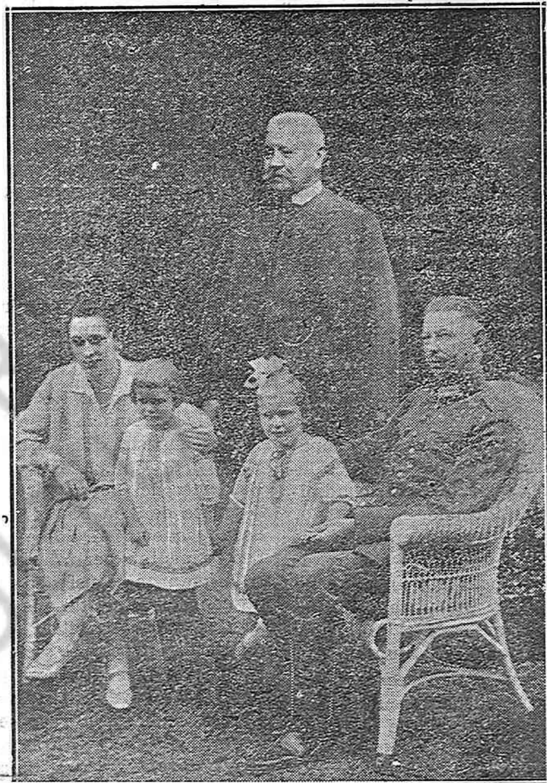
Una de las últimas fotografías familiares del Mariscal, acompañado de su hijo y ayudante, Oberst Von Hindenburg; de su hija política y de sus nietas.