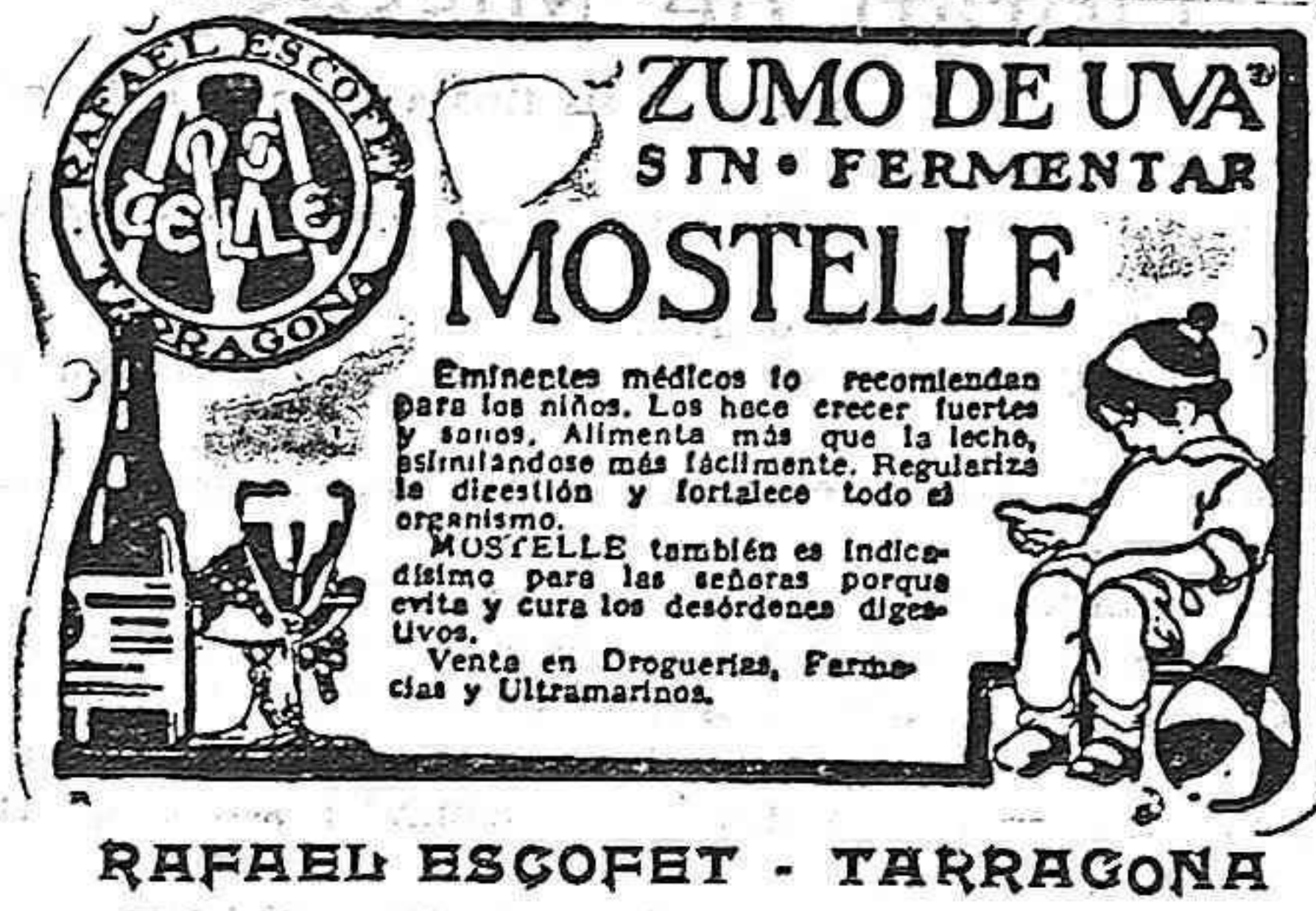
RAFAEL ESCOFET - TARRAGONA

Pláceme dejar que levante el vuelo la imaginación, sentado en el suelo de la sala capitular, mirando las sepulturas de los abades cuyas lúdas se me figura que se alzan suavemente para que los cuerpos allí conservados protesten de mi presencia en su cámara mortuoria. Otras veces es en la iglesia donde admiro el famoso retablo de Damián Forment, que fué el pretexto para que los monjes rebeldes engrasen el castigo al famoso abade