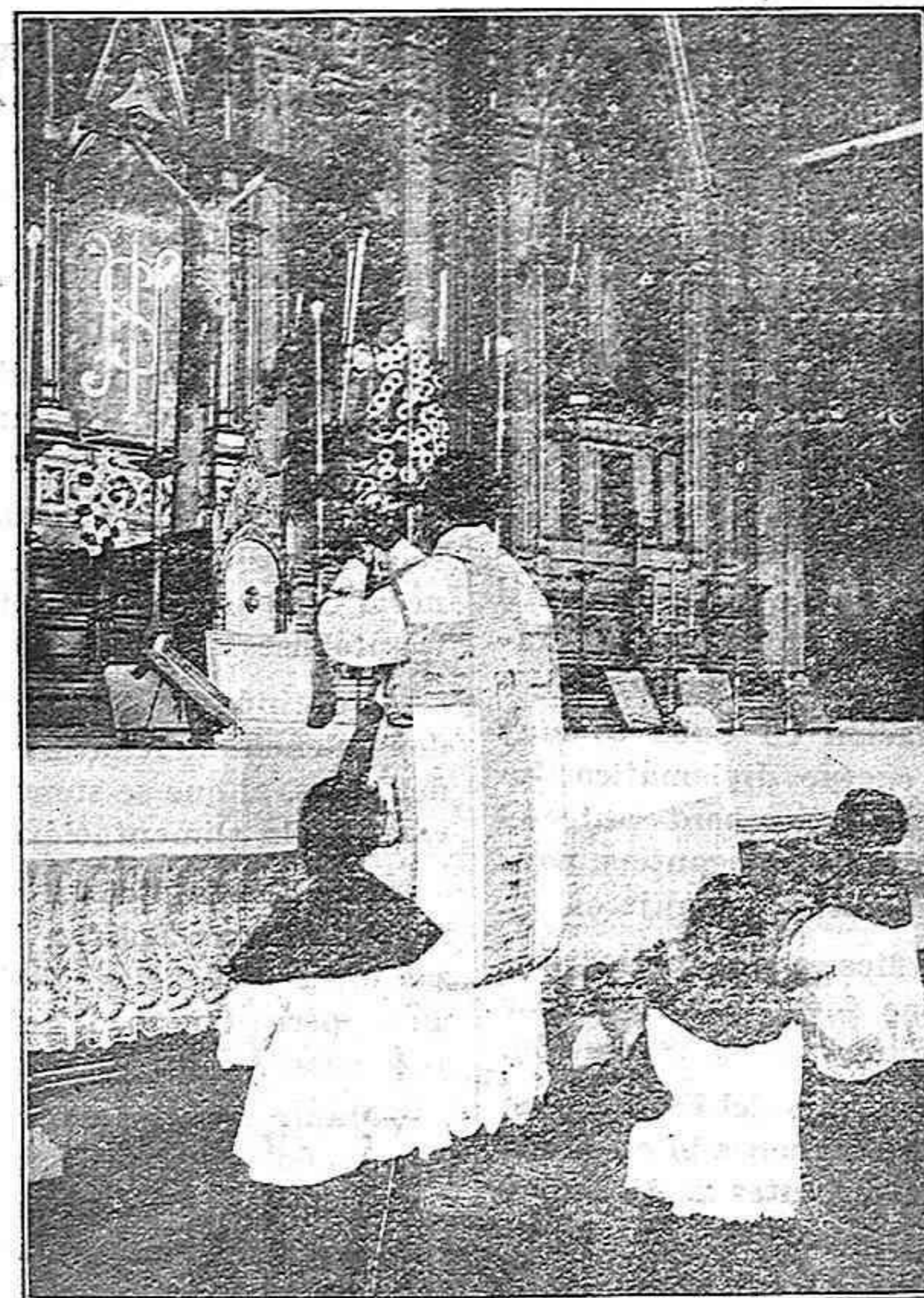
Misa solemne en la Catedral de Santa Isabel

cial la agricultura, la ganadería, la pesca, que eran allí desconocidas casi por completo, siendo ya general entre los indígenas, educados por los Misioneros el cultivo de sus fincas de cacao y de otros productos. Entre éstos se han ensayado varios cultivos europeos y coloniales, como el maíz, arroz, legumbres, patatas, hortalizas, café, algodón, tabaco, vainilla, caucho, etc.