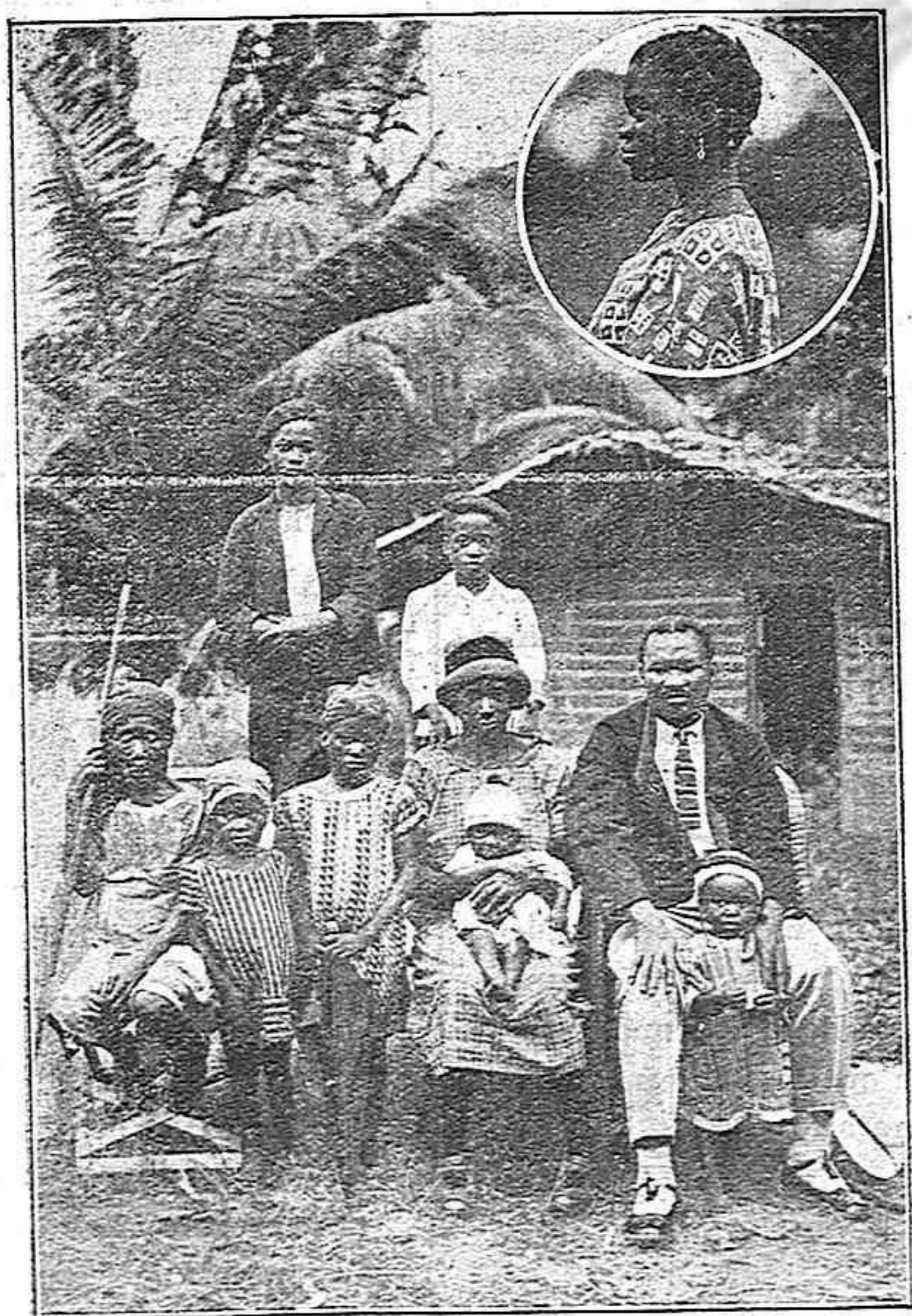
Familia evangelizada por los Misioneros

6.º Construcción de muelles de piedra en la isla de Elobey y en la