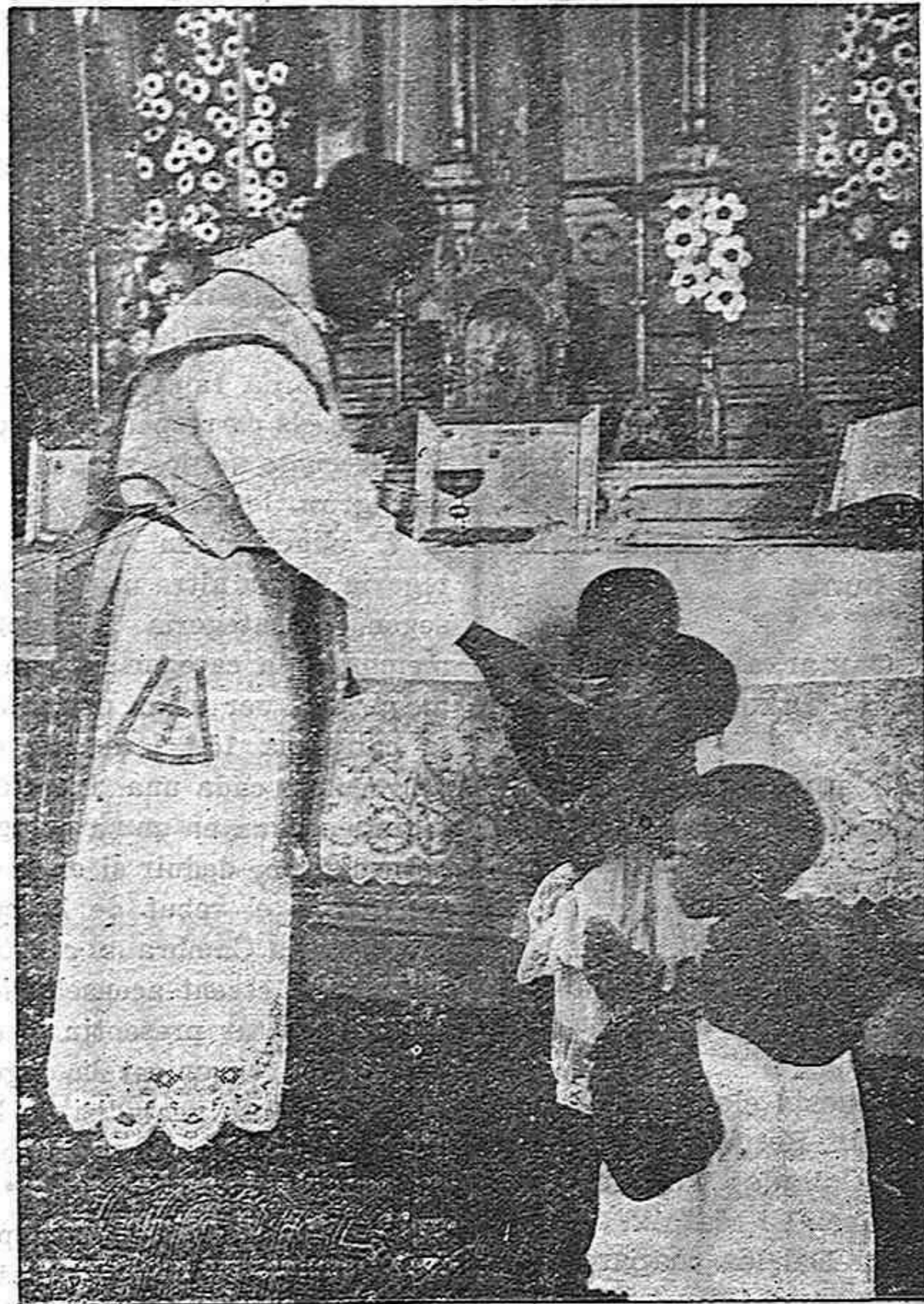
Primera Comunión de niños indígenas.

A los gastos de construcción y ornamentación, que superan a 500 mil pesetas, han contribuido varios indígenas de la Colonia, incluso protestantes, así como individuos y casas comerciales nacionales y extranjeras radicadas en la Colonia, siendo algunas casas o individuos extranjeros también protestantes.