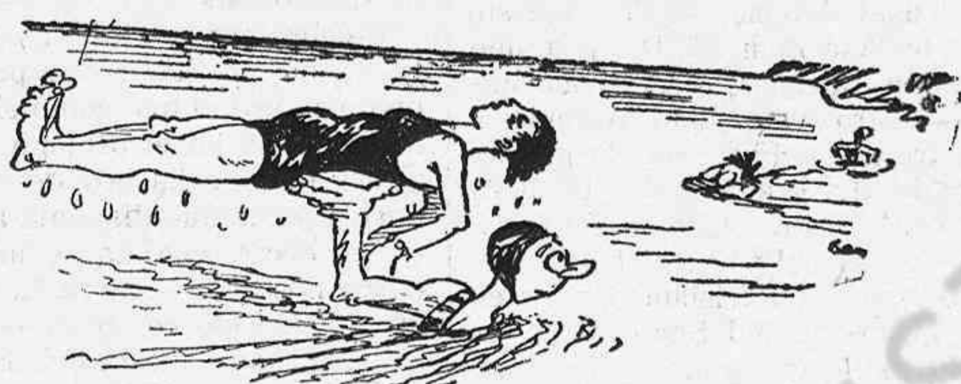
El naufrag. — Deixa'm anar, que em fas pesigolles.