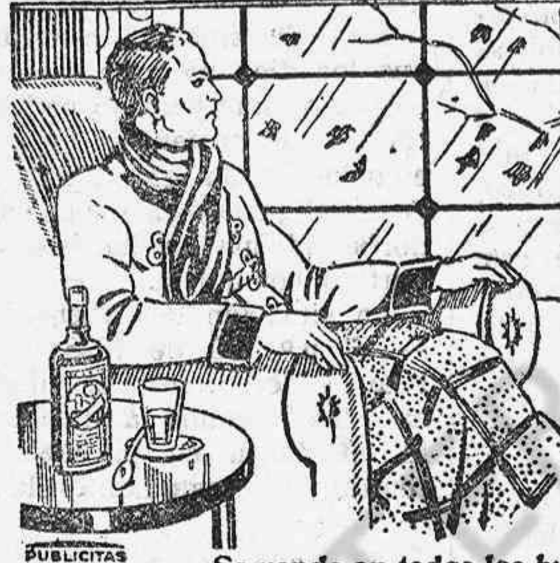
Se vende en todas las buenas Farmacias, a Ptas 5'00 el frasco

Suc de Torres & Virgili. — San Francisco, 14. — Tarragona