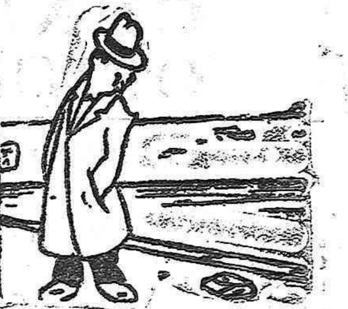
El carterista. — Un moneder! Ara em posaré malalt. El metge m'ha prohibit cap emoció forta. («Pages Gales», Yverdon.)