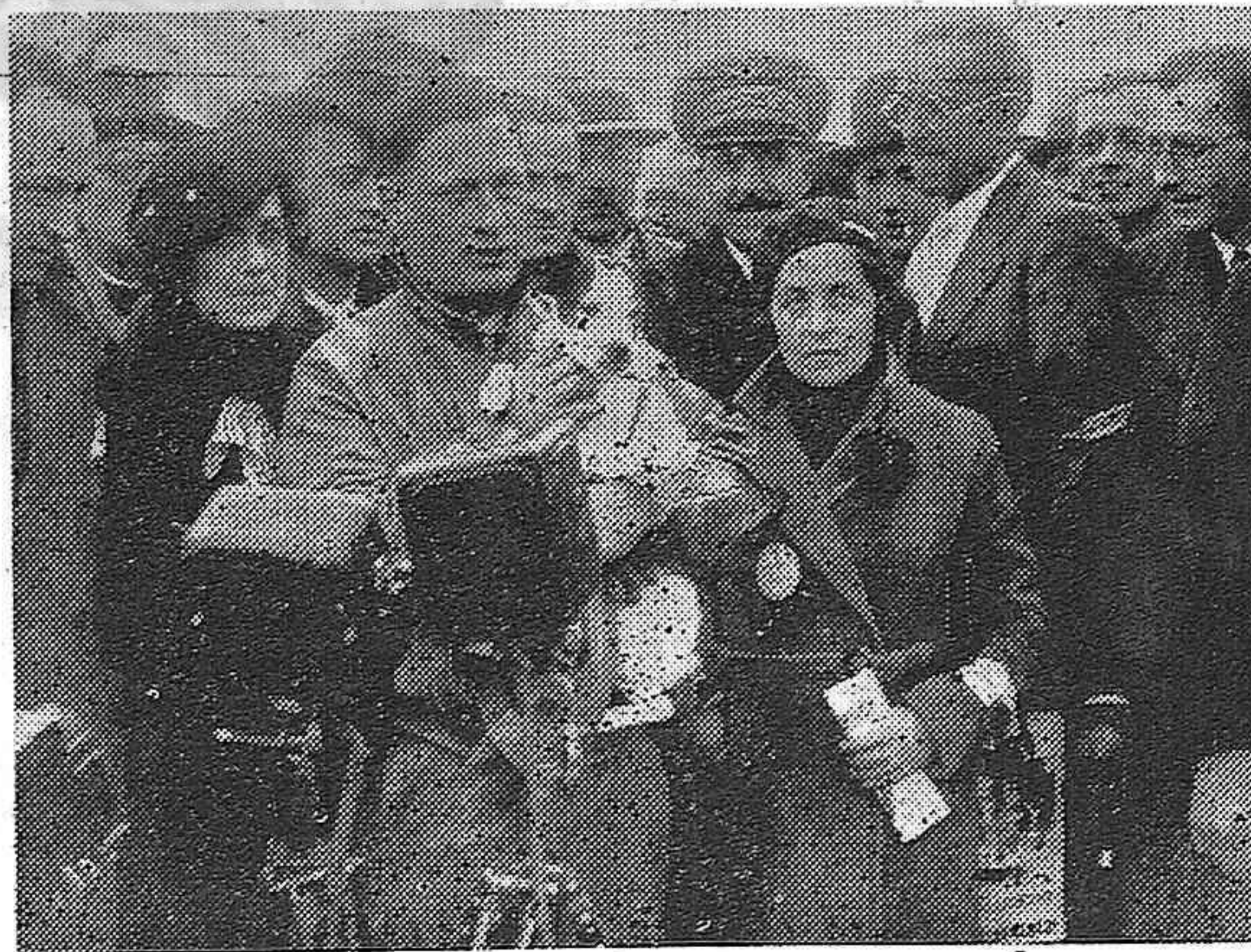
La Copa "Deutsch de la Neurthe" ha sido ganada por el aviador Delmotte, en Etampes-Mon-desir. Después de su victoria, Delmotte es felicitado por la señorita Deutsch de la Neurthe, la cual le hizo entrega de la copa, y por el general Densin.