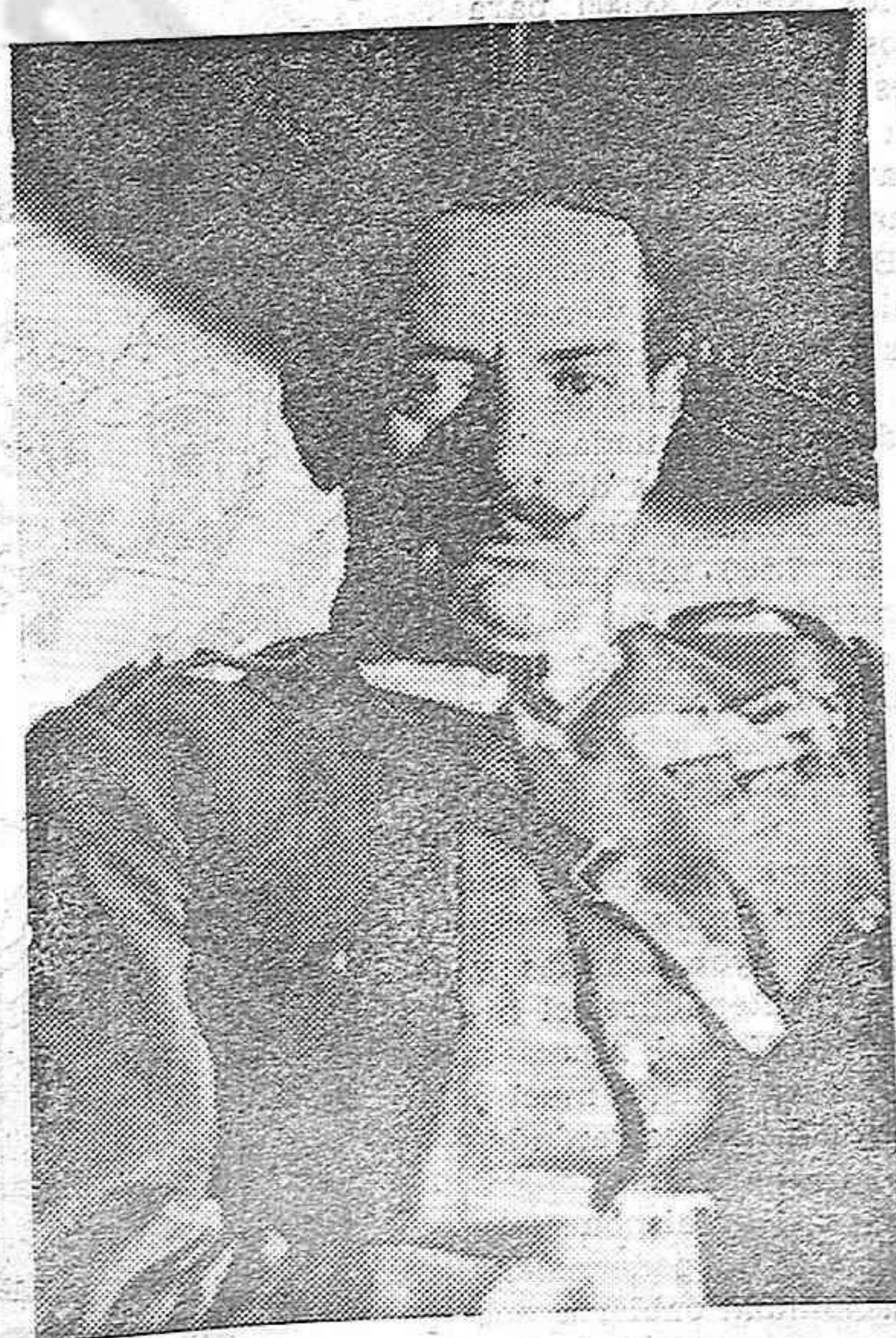
Un reciente retrato del general Kondylis, ministro de la guerra de Grecia, que dirige las operaciones contra los sublevados.