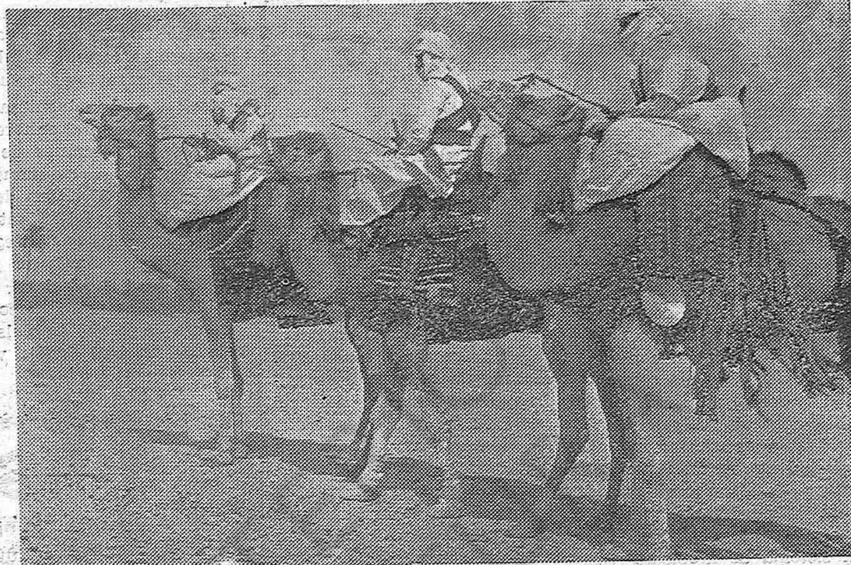
Continúan los preparativos italianos que contrastan con los buenos deseos de arreglar las diferencias pacíficamente que demuestran los abisinos. Una patrulla abisina vigilando la frontera.

nor de Sant Tomàs, la devoció envers el qual és revifa entre els estudiants que ens fa esperar que en anys successius serà encara més gloriosa i brillant. I ara, a esperar el complement de la festa amb la I Exposició del Llibre que, si Déu vol, s'inaugurarà el proper diumenge, dia 10, a les onze del matí i al Teatre Metropol, amb una conferència a càrrec de l'illustre literat senyor Josep Maria Capdevila, sobre "Sant Tomàs i els estudiants".