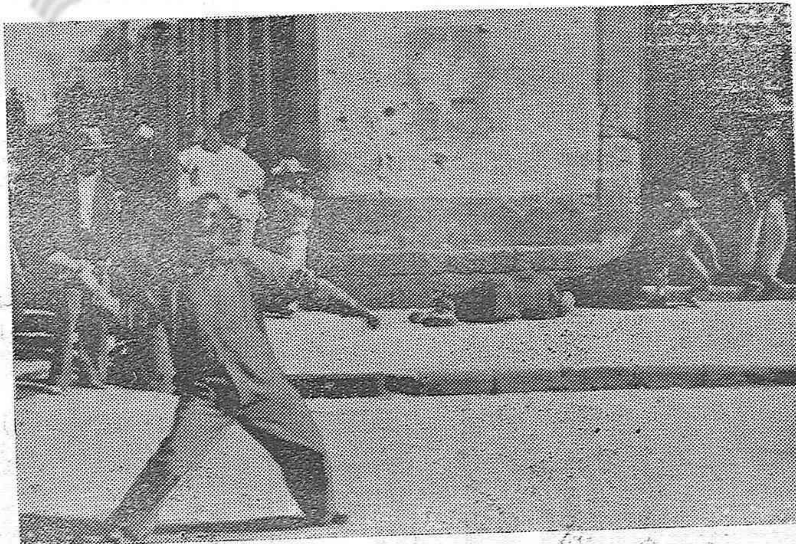
Las luchas religiosas se multiplican en Méjico. Continúa mente los católicos son motivo de ataques por parte de los rojos. Aquí vemos a un grupo de extremistas apedreando a unos fieles que se han refugiado en la iglesia en Villa de Guadalupe.