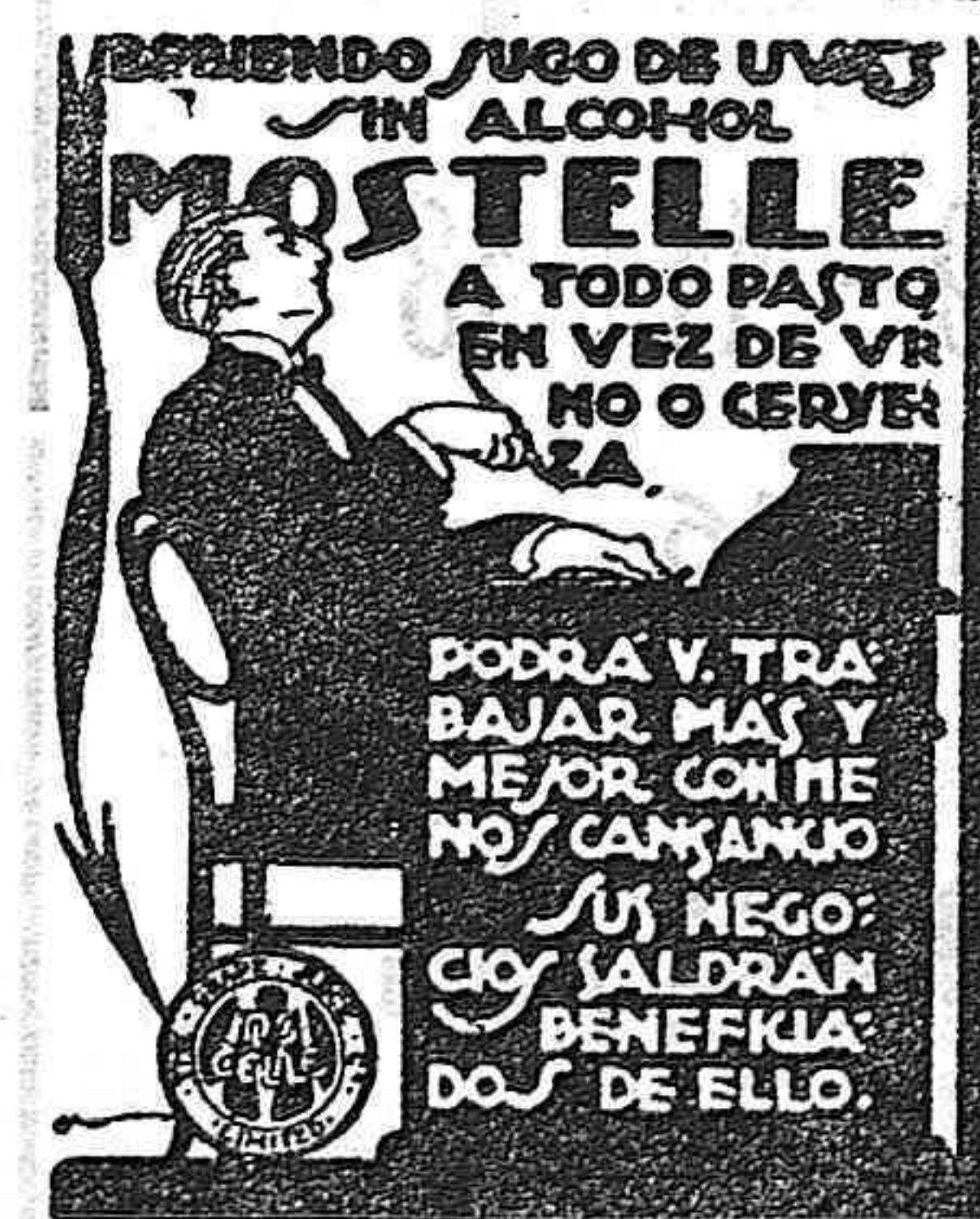
RAFAEL ESCOFET. — Tarragona