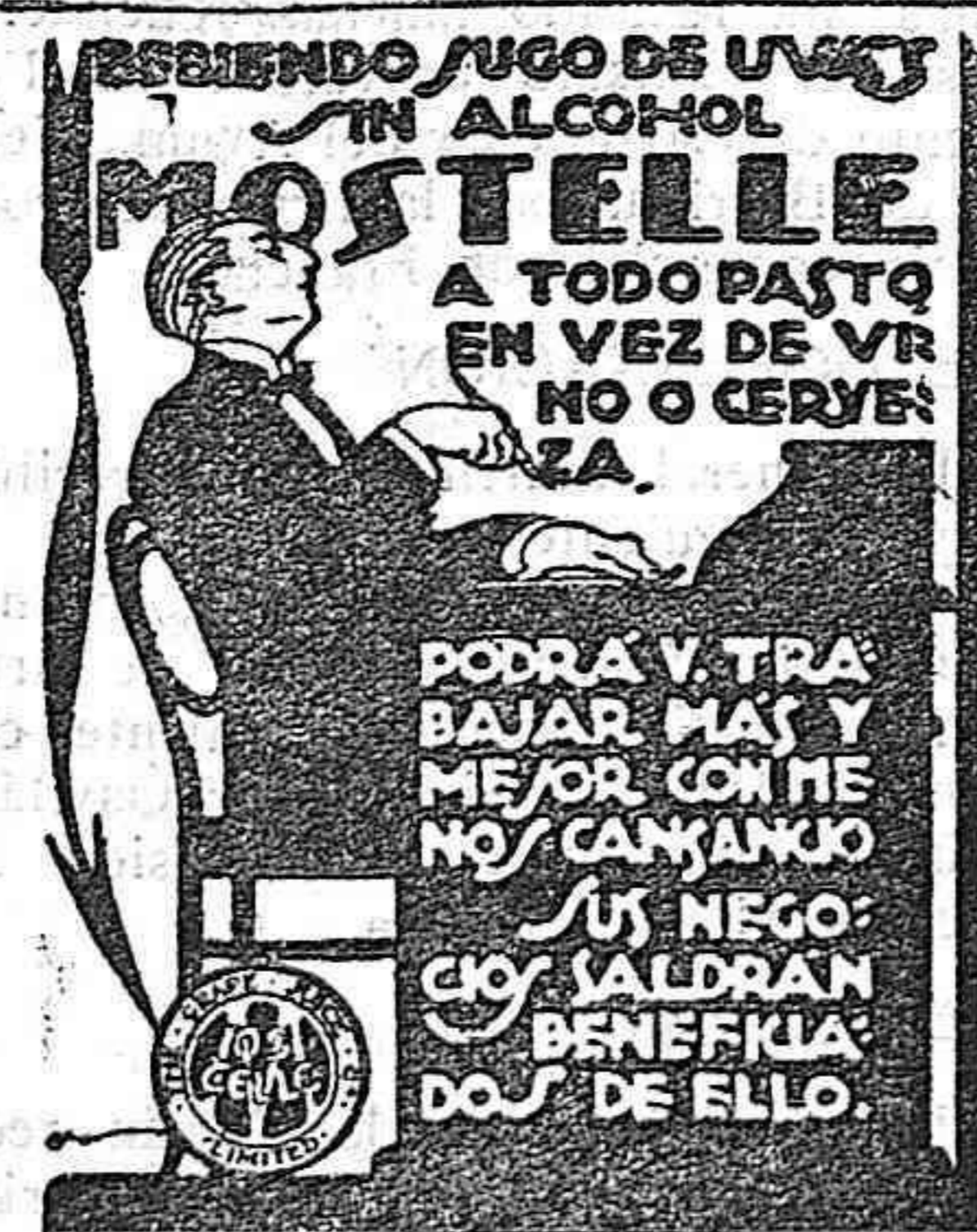
RAFAEL ESCOFET. — Tarragona