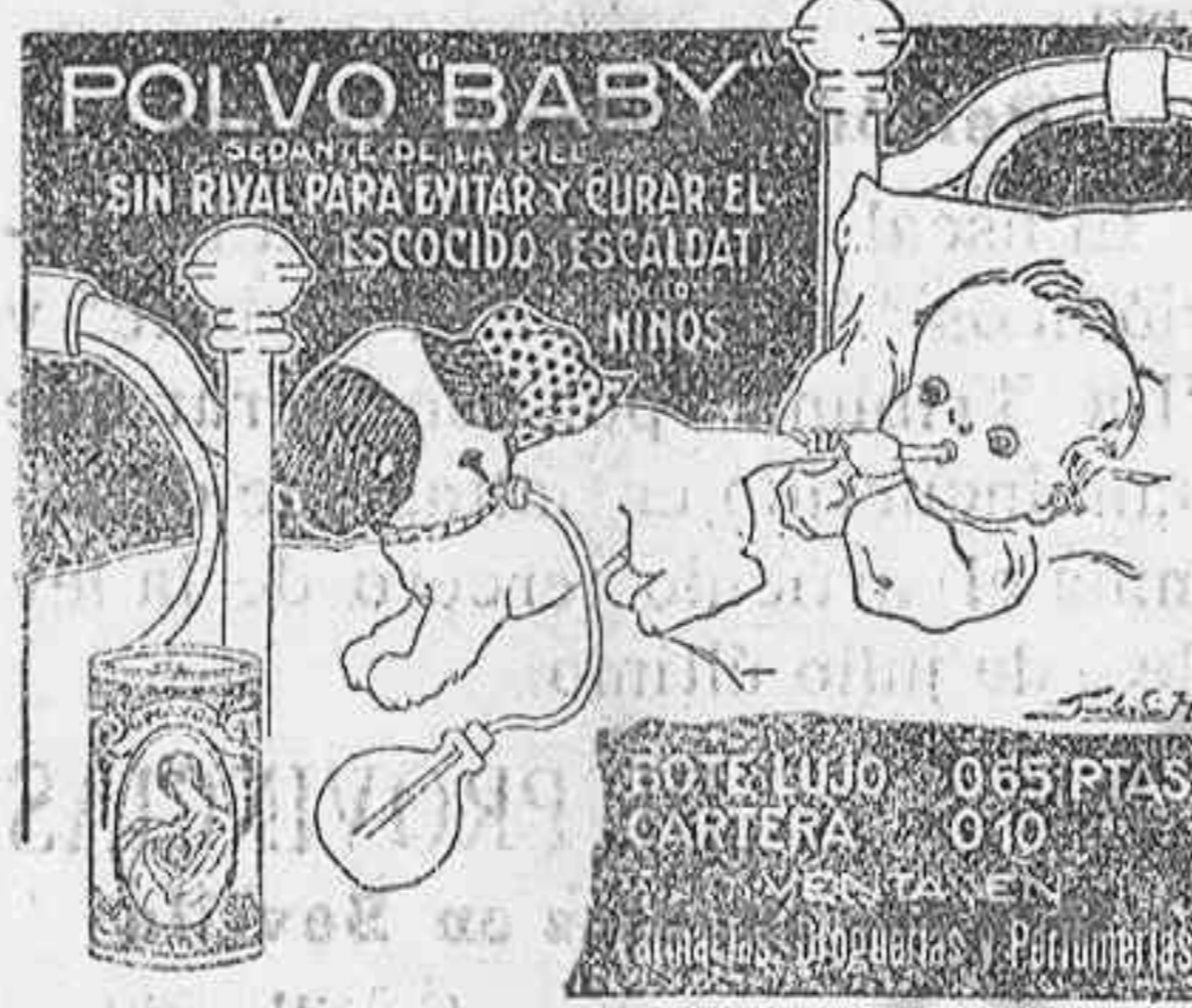
POLVO BABY SIN RIVAL PARA EVITAR Y CURAR EL ESCOCCIDO ESCALDAR NINOS

A los que no envíen ni siquiera los quince céntimos se les dejará de enviar la Revista, entendiéndose que no la leen o que no quieren recibirla.