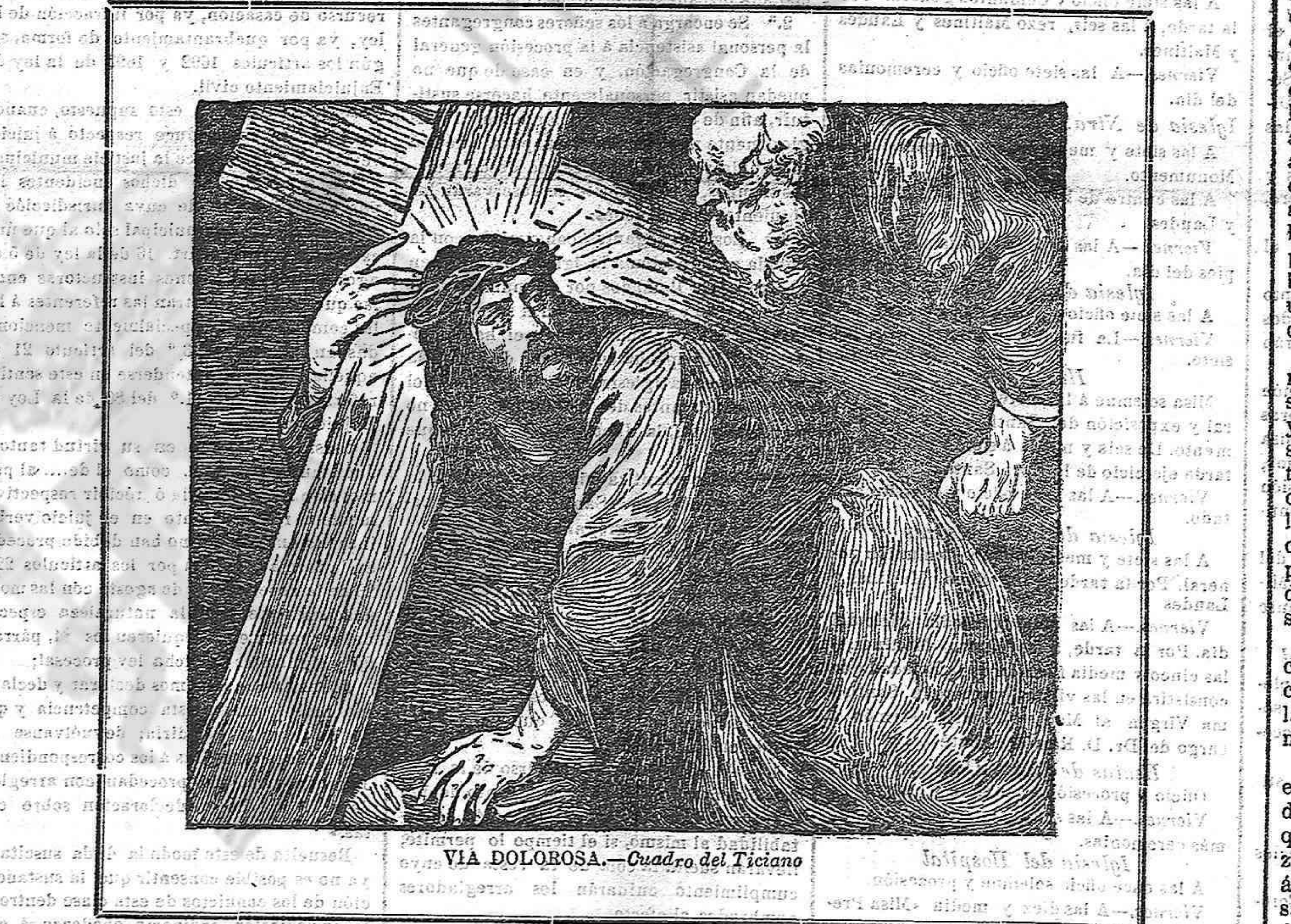
VIA DOLOROSA.—Cuadro del Ticiano

Oh dolc cremar! Oh goig sense manera Sols desitjo, Senyor, que eixa foguera no drida ab vent de contrició se refongui en la flama justiciera que us immola ab incendis de dol.