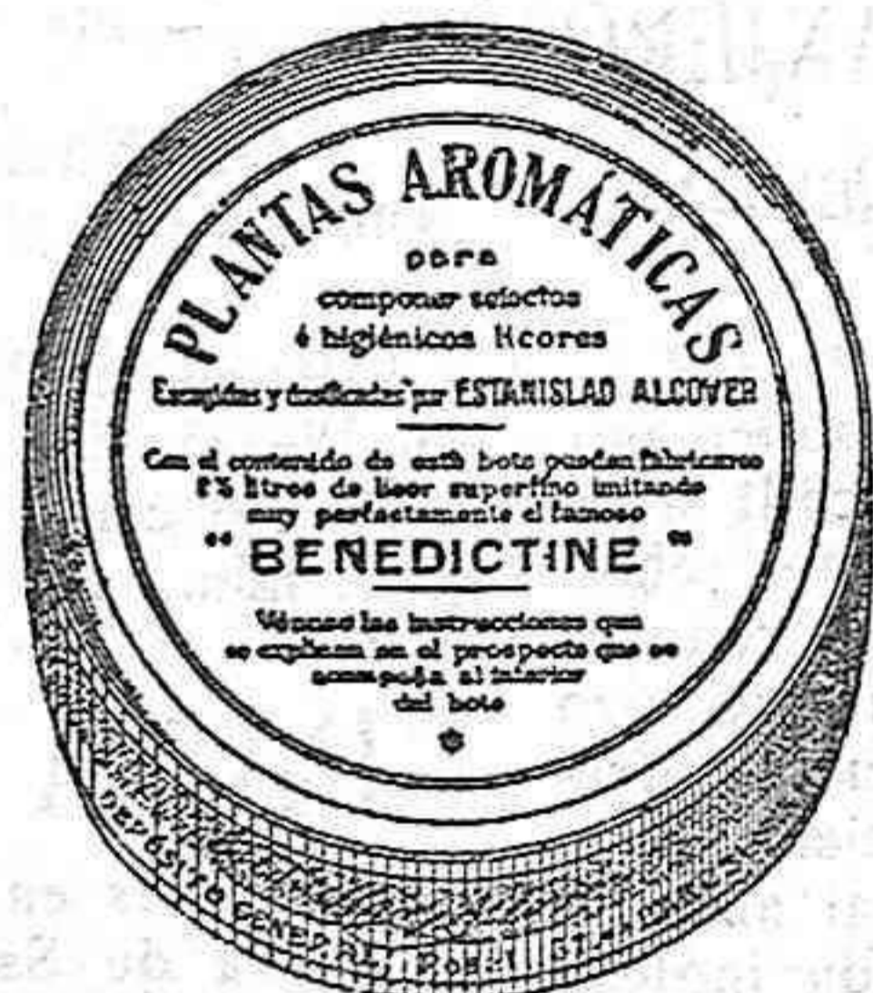
Facsimil del bote

Para la preparación, con el sólo concurso de vegetales de SELECTOS E HIGIENICOS LICORES similares a las más acreditadas marcas.