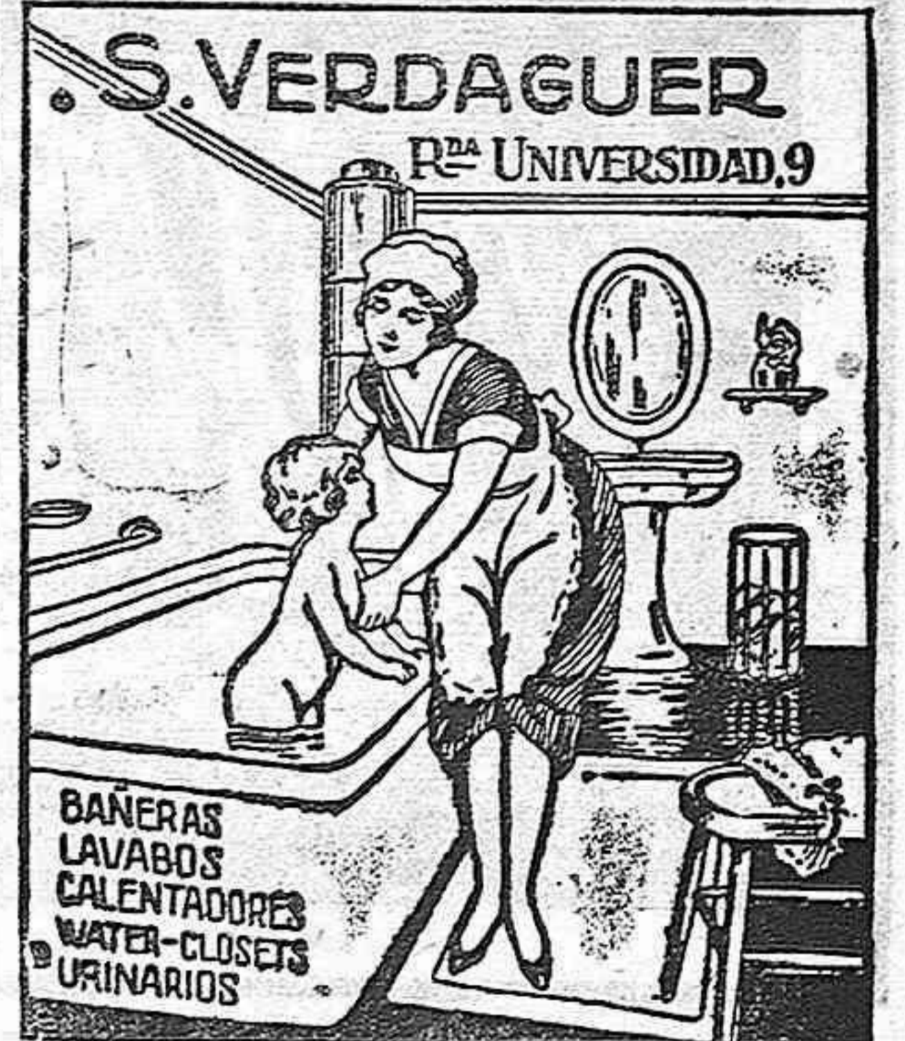
BARCELONA. Teléfono 1662 A