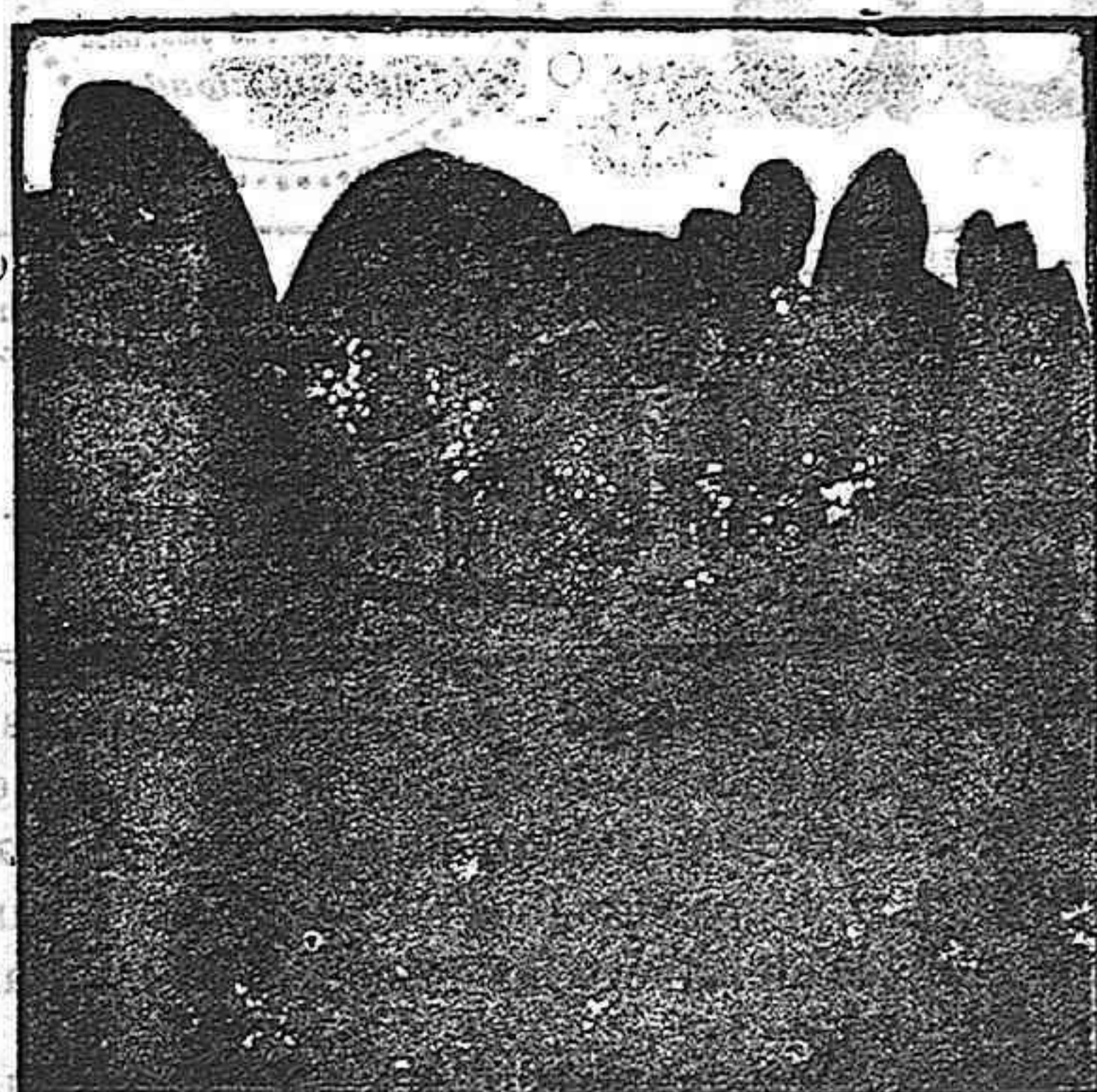
Hileras de Cactus Eurbank emitiendo hojas

La ciudad de Valls, para honrar á su patrona la Virgen de la Candela con motivo del segundo decenario del segundo siglo de su fundación, celebrará durante los días del 1 al 6 de febrero, grandes fiestas cívico-religiosas, siendo las más importantes las siguientes: Inauguración del Paseo de la Estación, Coronación canónica de la patrona de Valls, la Virgen de la Candela, Xiquets de Valls, Solemnísima procesión, llevando el pendón principal un delegado de S. M. el Rey D. Alfonso XIII (q. D. g.), castillo de fuegos artificiales, bailes de sociedad, misa de campaña, Juegos Florales organizados por el Ayuntamiento, cabalgata y retreta, carreras de bicicletas, etc.