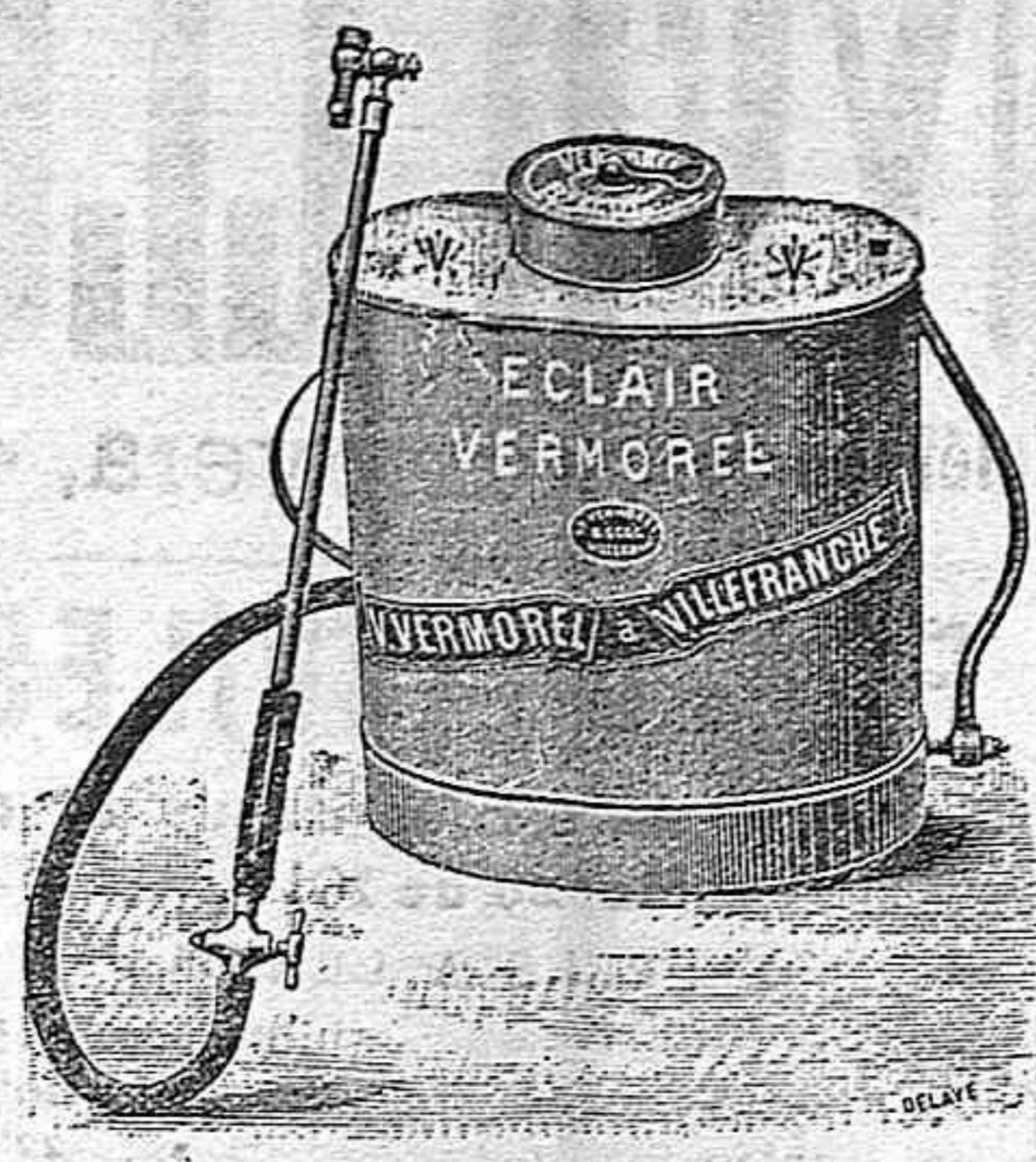
Pulverizadores Vermorel ptas. 50.