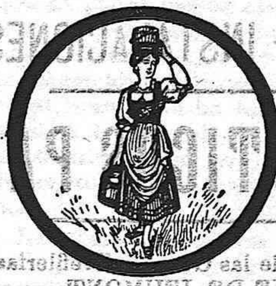
MARCA DE FABRICA

Hoja de olivo SE COMPRA CASTELAR, 4, BAJOS