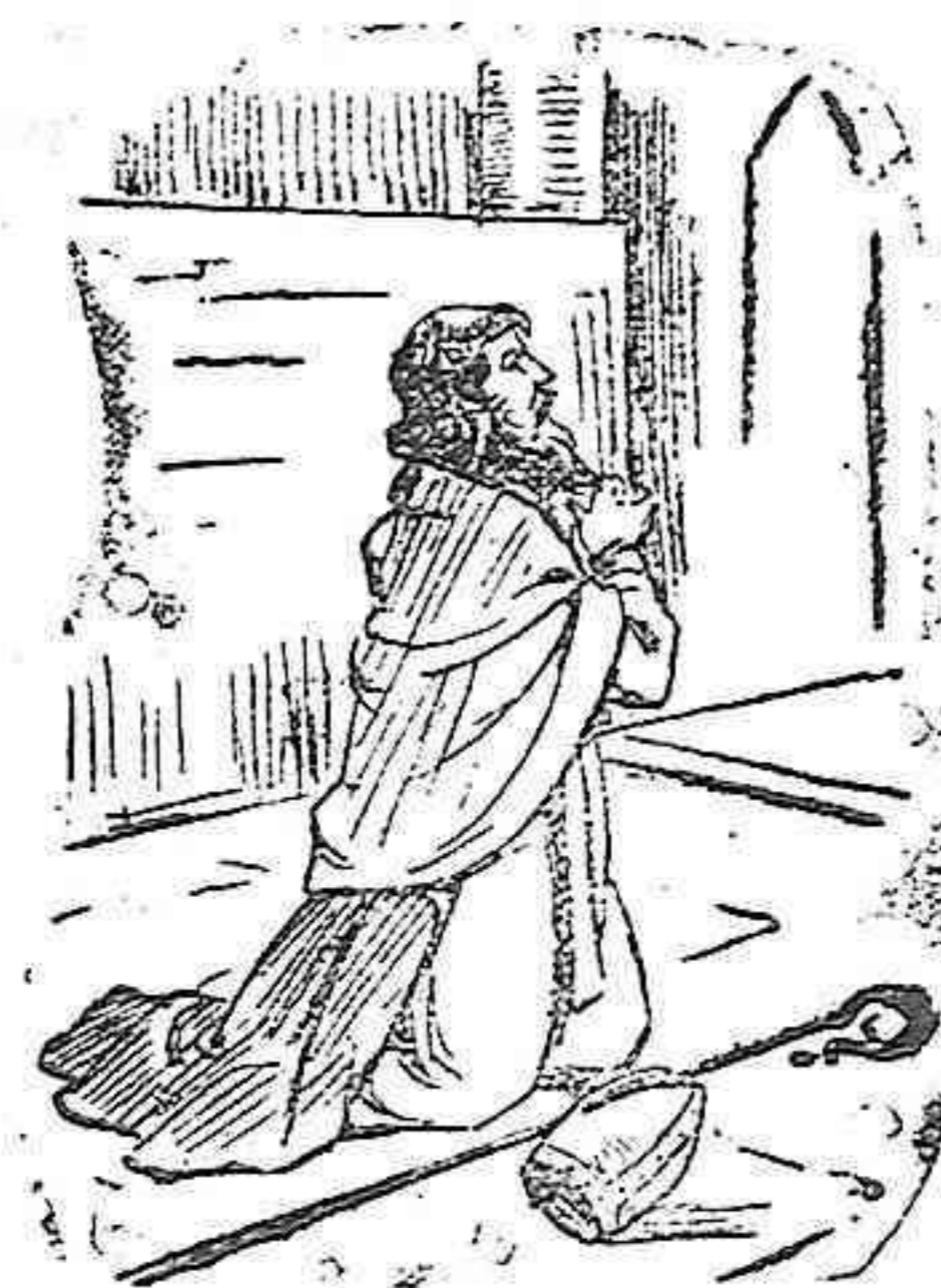
Martirologio: SAN SEVERO

Descendiendo de una ilustre familia, dedícose al cultivo de las letras, llamándole Dios al estado eclesiástico, en el que se distinguió por su talento y virtudes. Por ello, vacante el obispado de Barcelona, fué elevado á él, en el cual resplandeció como antorcha divina, alumbrando el verdadero camino de la salvación de las almas.