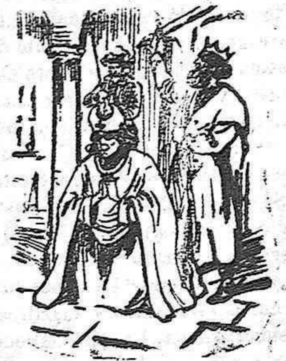
Martirologio: SAN ESTANISLAO

Hijo Estanislao de una rica familia de Polonia, al quedarse huérfano distribuyó entre los pobres la cuantiosa fortuna que había heredado y se ordenó de sacerdote, llegando por sus virtudes y talento á ceñir la mitra de su diócesis. Combatió el error y el libertinaje con tal ahínco, que hasta el mismo rey Ladislao II no se libró de sus censuras, dirigidas á encaminarlo por el sendero de la fe y á que depusiera su odio á los cristianos. Ofendido por ello el monarca juró desembarazarse de él, y á este fin, el 3 de Mayo del año 1079, en ocasión de hallarse el obispo celebrando la misa, el mismo le dió muerte, y haciendo pedazos el cadáver, mandó que fueran aquellos arrojados al campo para pasto de las aves de rapiña. Pero no permitiendo el Señor que tal profanación se consumara, un mandó águila en defensa de tan sagrados despojos y entonces el cabildo pudo recogerlos dándoles honrosa sepultura.