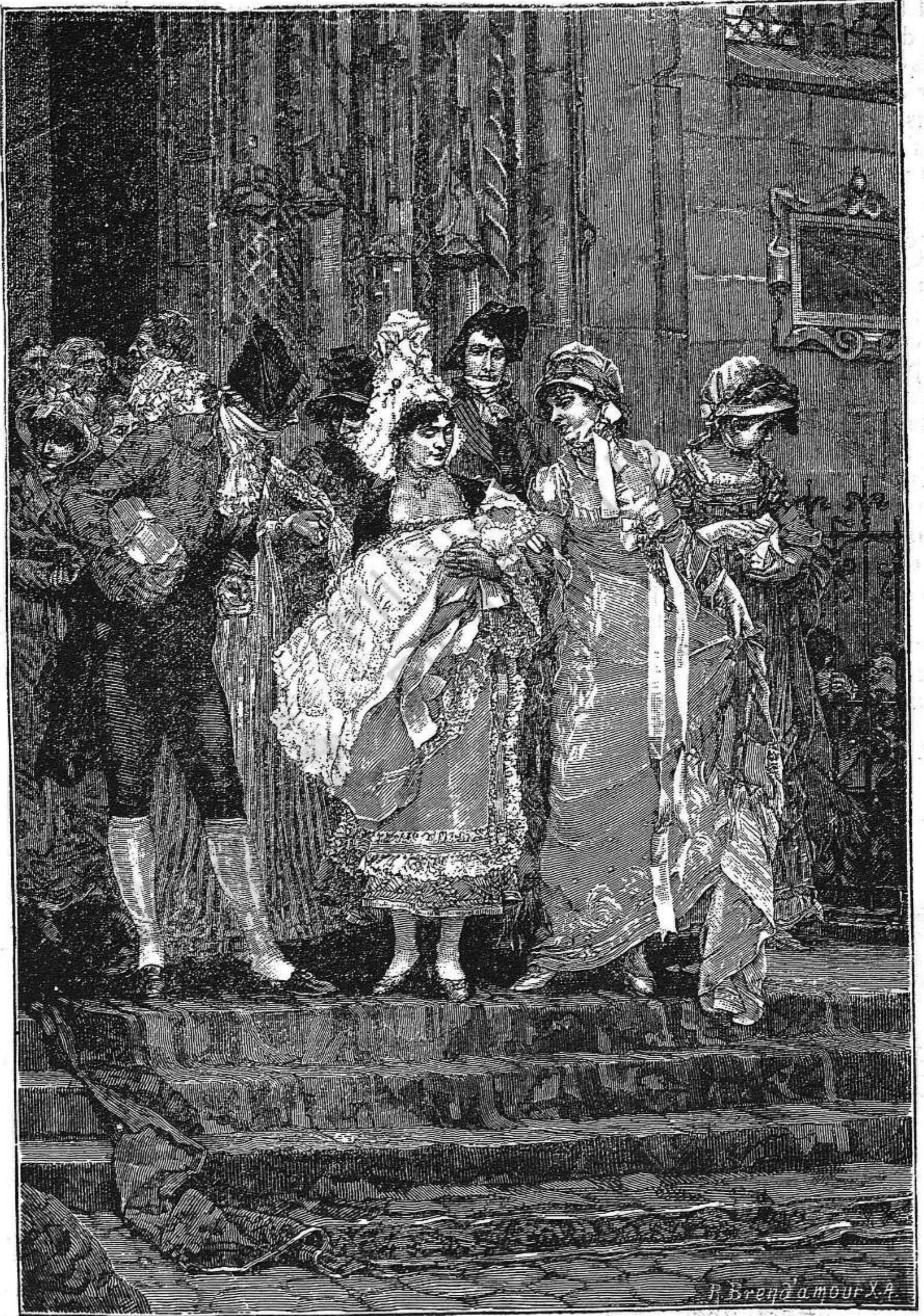
UN BATEIG EN TEMPS DEL DIRECTORI ( Kaemmerer )