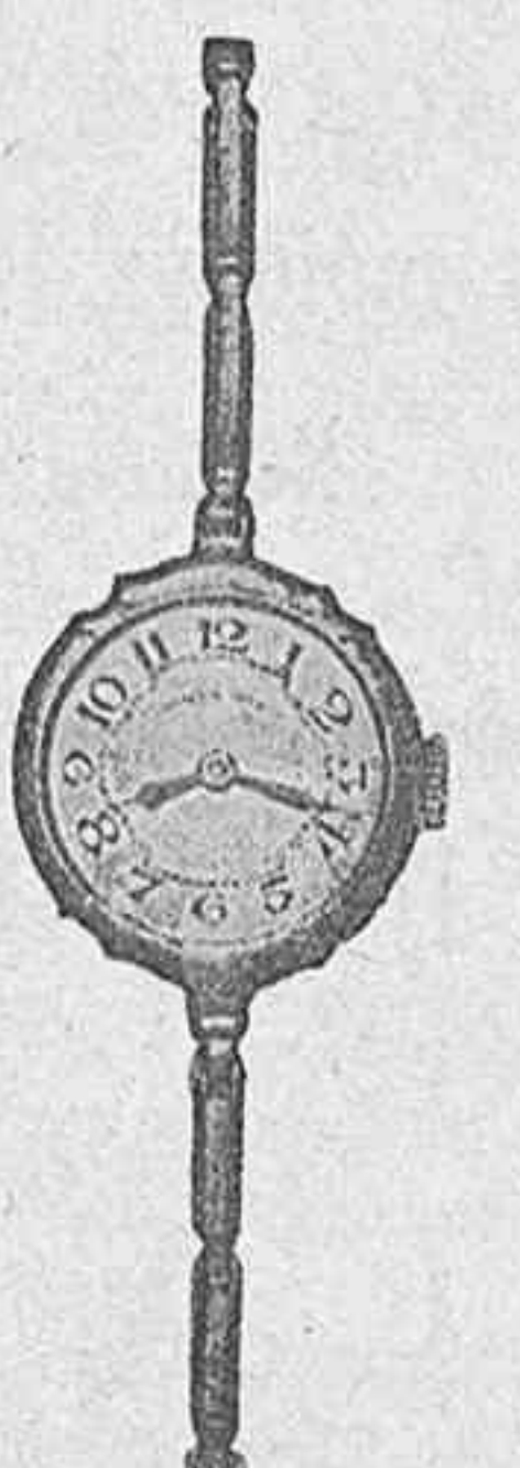
CHAPADO Desde 18 pesetas