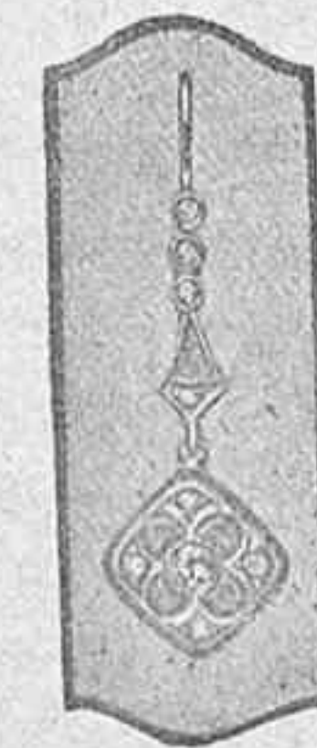
PENDIENTES Oro Ley 18 Kilates con 16 Diamantes Desde 40 pesetas