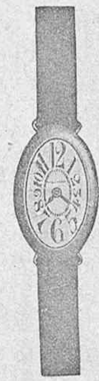
CHAPADO Desde 60 pesetas

Unica casa que cuenta con taller para toda clase de composturas en joyas, relojes, gramófonos y óptica; se hacen toda clase de recetas de los señores oculistas.